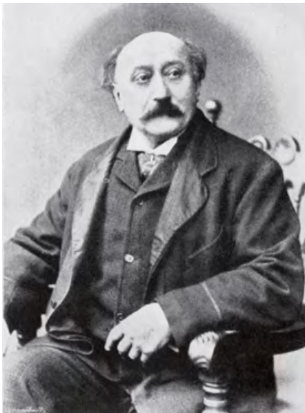
La troupe Arditi entreprend à Montréal, puis à Toronto, une tournée de 14 mois qu'elle poursuit dans 21 villes du Midwest américain, dont certaines entendent de l'opéra pour la première fois. De retour à Montréal du 24 au 29 décembre 1883, Luigi Arditi, à la tête de la troupe de l'Academy of Music de New York, dirige La sonnambula , La traviata , Il trovatore et Lucia di Lammermoor dont il avait donné la première canadienne en 1853. (Luigi Arditi, My Reminiscences , iv).

prendra une saison d'opéra italien de deux semaines au Théâtre Royal, avec un effectif de 40 personnes, chanteurs et musiciens compris! Le répertoire était composé de trois opéras de Donizetti en première canadienne, Lucia di Lammermoor , Lucrezia Borgia et La favorita , en plus de Norma de Bellini, dont on ne connaissait que la version tronquée. Un effectif si maigre pour un répertoire si exigeant? Hum! Pas facile de circuler des deux côtés de la frontière. Vous prenez d'abord un bateau qui emprunte le fleuve Hudson, le lac Champlain et la rivière Richelieu jusqu'à Saint-Jean, puis un train vous conduit à La Prairie et, de là, vous montez sur un vapeur qui vous débarque finalement à Montréal. Dans ces conditions, comment déplacer un personnel important, des décors imposants et une garde-robe élaborée? Pour la première fois, les amateurs entendent de l'opéra italien « authentique ». Le public et la presse applaudissent, mais le chroniqueur de la