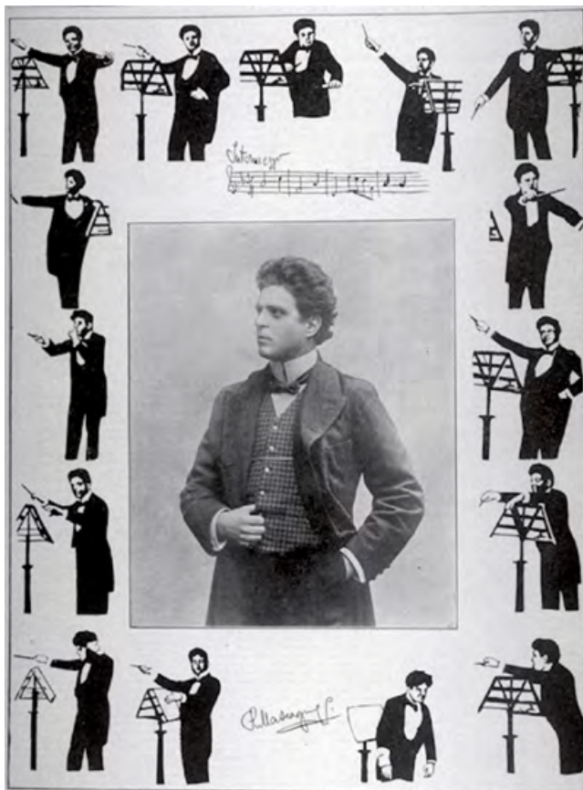
L'Europe reconnaissait les qualités de chef d'orchestre de Mascagni depuis une décennie. Le critique du Herald est conquis : « Tantôt avec fermeté, tantôt avec souplesse, et à l'aide de la baguette que manie élégamment sa main droite, il dessine dans l'espace les nuances recherchées, accélérant le tempo et passant graduellement du pianissimo au forte, se laissant emporter tel un cavalier qui, armé de son sabre, mène la marche. » (2745743, Pietro Mascagni. Photographie et silhouettes. L'album universel , 8 nov. 1902. BANQ, Collection numérique).

Auparavant, le 4 novembre 1904, la Henry Savage Grand Opera Company fait connaître à Montréal un troisième compositeur vériste, Giacomo Puccini, avec sa version personnelle de La bohème . Histoire attachante, selon le Herald , qui mêle éléments romantiques et réalistes, avec une touche impressionniste. Savage mise encore sur Puccini, le 14 novembre 1907, avec Madama Butterfly , trois ans après sa création milanaise. Pas un seul fauteuil libre au Majesty's tant La bohème a marqué les amateurs. Enfin, La fanciulla del West , offerte par la Quinlan English Opera Company, prend l'affiche le 14 mars 1914, un peu moins de quatre ans après sa création au Metropolitan Opera, mais ce western spaghetti avant la lettre passionne peu la critique.