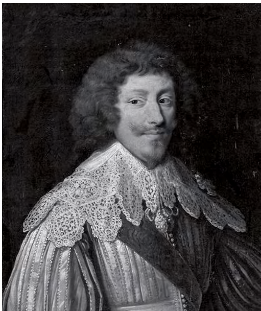
Henri II de Montmorency (1592-1632). Il fut vice-roi de la Nouvelle-France de 1620 à 1624. Œuvre d'un peintre anonyme (Musée de Louvre).

Dans notre histoire, le régime seigneurial est presque systématiquement réduit à sa dimension territoriale, à la manière d'occuper l'espace, voire simplement à une géométrie (les rectangles allongés