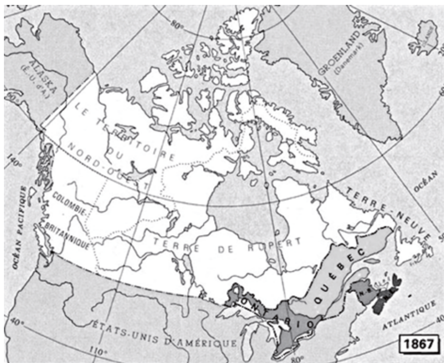
Le Nouveau-Brunswick, la Nouvelle-Écosse et le Canada s'unissent pour former un État fédéral, le Dominion du Canada (Acte de l'Amérique britannique du Nord, 1 er juillet, 1867). La Province du Canada est divisée en Québec et Ontario. Les États-Unis d'Amérique proclament avoir acquis l'Alaska de la Russie (20 juin).

Les commémorations autour de la Confédération canadienne de 1867 nous offrent l'occasion, qu'il importe de saisir, de penser à nouveau les fractures auxquelles elle a donné naissance. L'année 1867 a non seulement opposé les Canadiens français et les Canadiens anglais : elle a également créé une division entre eux et les peuples autochtones. La rétrospective politique et législative précédente montre que les autorités canadiennes ont creusé cet écart fondateur dans les années qui ont suivi la Confédération. La question de la place des Autoch-