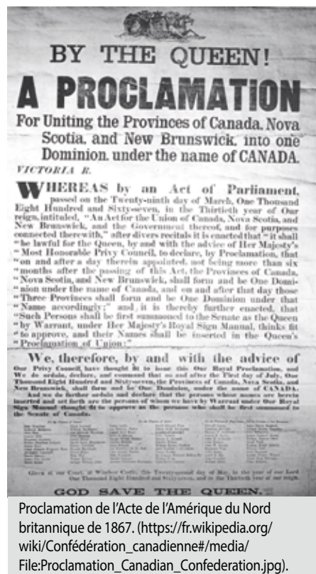
Proclamation de l'Acte de l'Amérique du Nord britannique de 1867. ( https://fr.wikipedia.org/wiki/Confédération_canadienne#/media:File:Proclamation_Canadian_Confederation.jpg ).

Carte du nouveau dominion de Canada de 1867. ( http://www.collectionscanada.gc.ca/obj/023001/f1/1867-v5-f.jpg ).