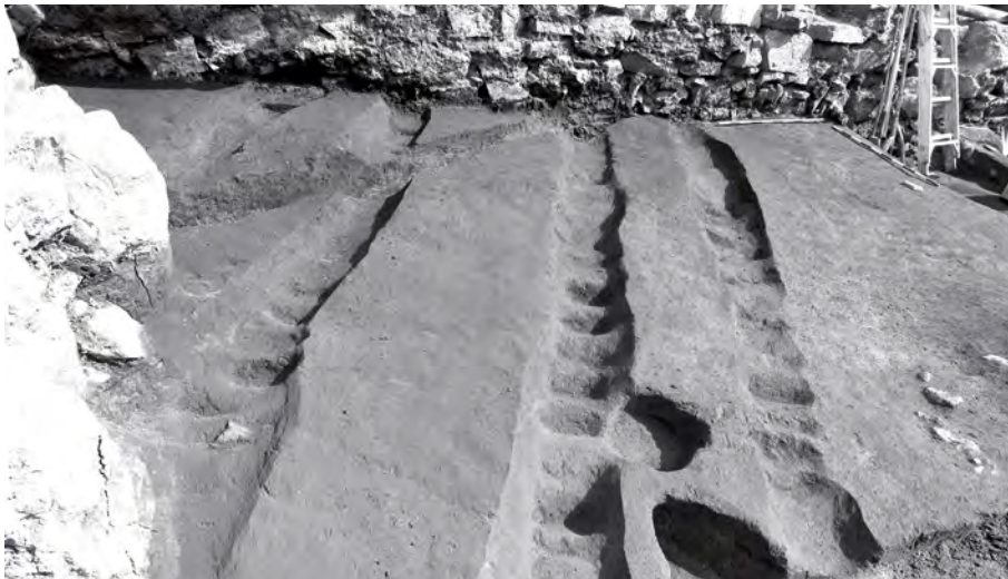
Les sillons de culture observés aux abords de l'ancienne petite rivière Saint-Pierre à quelques pas du fort, mais dans un niveau sous-jacent à ce dernier. Les « redents » ainsi dégagés font penser aux traces laissées par une houë, selon une technique européenne. Pas moins de cinq alignements ont été mis au jour. Quelques perles de verre, de petits fragments d'os blanchis et des munitions y ont été observés. (Photo : Alain Vandal, Pointe-à-Callière).

gir de complexes et séculaires rivalités autochtones. La construction du fort Richelieu à l'embouchure de la rivière du même nom par Montmagny, quelques semaines après celui de Ville-Marie, donne le coup d'envoi aux hostilités entre Français et Iroquois, qui tolèrent mal cette intrusion nouvelle dans le réseau commercial des fourrures, mouvant et fragile.