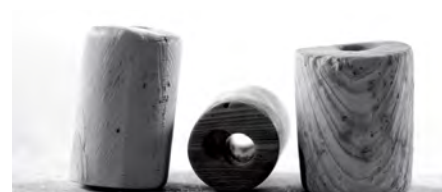
Perles de wampum. Tant les Européens que les Amérindiens fabriquent ces perles de coquillages provenant de la côte est de l'Atlantique, à l'aide d'outils en fer. Les colliers de wampum sont des objets diplomatiques de première importance.

Grâce aux négociations menées à la fin du XVII e siècle par Callière, par le chef huron Kondiaronk et par le chef iro-