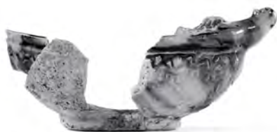
Une navette à encens en terre cuite de Saintonge polychrome, dont les fragments proviennent de différents niveaux de l'occupation du fort de Ville-Marie.

Mais les rencontres amorcées par Champlain au début du XVII e siècle changent la donne : la pointe devient un lieu propice aux échanges ne nécessitant qu'un séjour bref, à la belle saison. La présence amérindienne y est dès lors perceptible à travers le mobilier archéologique où se retrouvent aussi des objets européens. Le site aurait ainsi pris une nouvelle connotation, devenant un lieu de