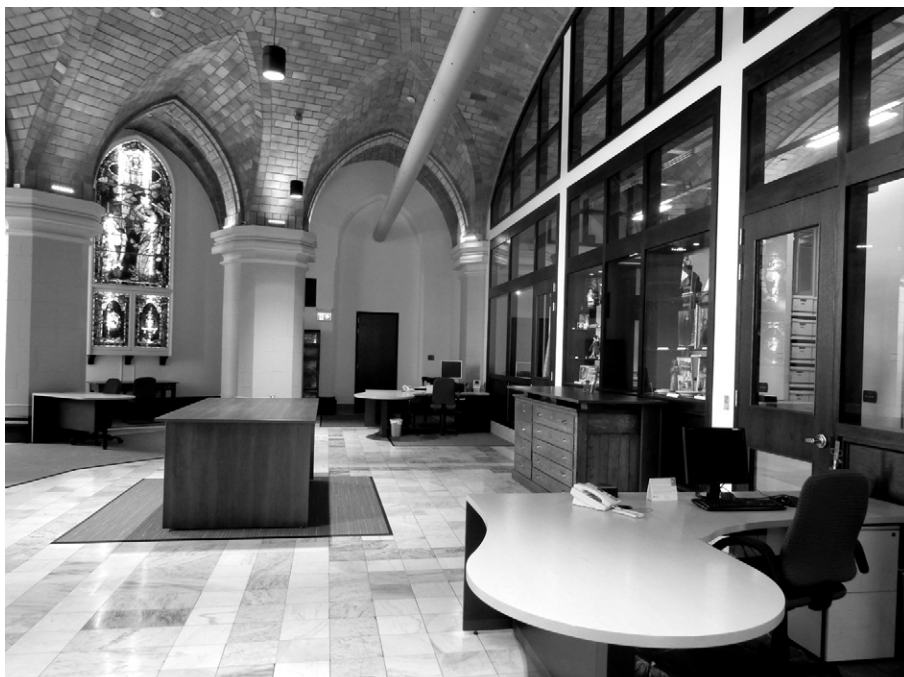
Vue partielle de l'aménagement. Au premier plan, un bureau du personnel, situé à côté de la porte d'accès à la voûte qui est vitrée. Au centre de la pièce, un meuble permettant la consultation de grands formats alors que les postes de travail individuels sont situés le long de l'abside, près des vitraux. Centre d'archives Mgr-Antoine-Racine.

tion. En établissant une plateforme d'échanges, le comité a permis de réunir avec des autorités ecclésiastiques, des archivistes du milieu et des spécialistes de diverses disciplines pour aborder des problématiques criantes.