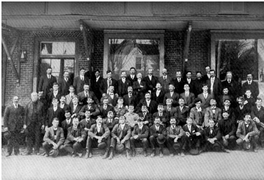
Instructeurs du gouvernement ou des municipalités, qui, au printemps de 1913, ont suivi, à Knowlton un cours de confection de macadam donné par les ingénieurs et les inspecteurs du ministère de la Voirie. (Rapport du ministère de la Voirie de la province de Québec, 1913).

Le gouvernement, qui voulait mobiliser les cultivateurs, faisait appel à l'un des leurs. Ce gestionnaire très efficace devait, au cours des deux années suivantes, organiser le futur département de la Voirie à partir du service de la voirie qui s'était constitué au sein du ministère de l'Agriculture. Des outils furent développés pour la collecte de l'information afin de dresser un inventaire du réseau de chemins existant. Les demandes de subventions firent l'objet d'une vérification auprès des municipalités, ce qui permit de normaliser la procédure par laquelle ces dernières devaient s'engager à renoncer à la corvée en échange de l'aide du gouvernement. Un mécanisme de suivi des travaux et du contrôle de l'entretien fut élaboré dans le but d'obtenir, sur une base journalière, un aperçu de l'avancement des travaux. Ces informations allaient permettre de localiser les régions les plus dynamiques pour élaborer les stratégies d'action, notamment pour planifier les interventions du gouvernement et dresser un inventaire très précis des améliorations apportées au réseau routier pour en rendre compte à la population et au gouvernement, tel qu'en feront foi les rapports annuels du ministre de la Voirie.