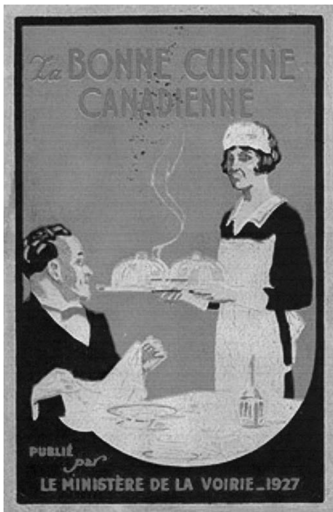
La bonne cuisine canadienne. Traité d'art culinaire à l'usage des hôtels de la province de Québec, préparé et publié sous la direction du ministère de la Voirie, mars 1927, 173 p. (Centre de documentation du ministère des Transports du Québec).

Le premier ministre Gouin, reporté au pouvoir le 23 juin 1919, passa le relais à