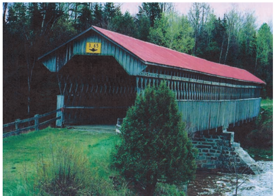
Les ponts couverts ont été la pierre angulaire de la colonisation de 1815 à 1955. Sur cette photographie, le pont McVetty-McKerry, à Lingwick, en Estrie, construit en 1893. (Ministère des transports du Québec).

pour le Canada était l'aménagement d'un réseau routier national. Cette loi est un bel exemple d'une approche fédérale, puisque le gouvernement du Canada semblait considérer le réseau routier provincial comme un complément au rail et au transport maritime.