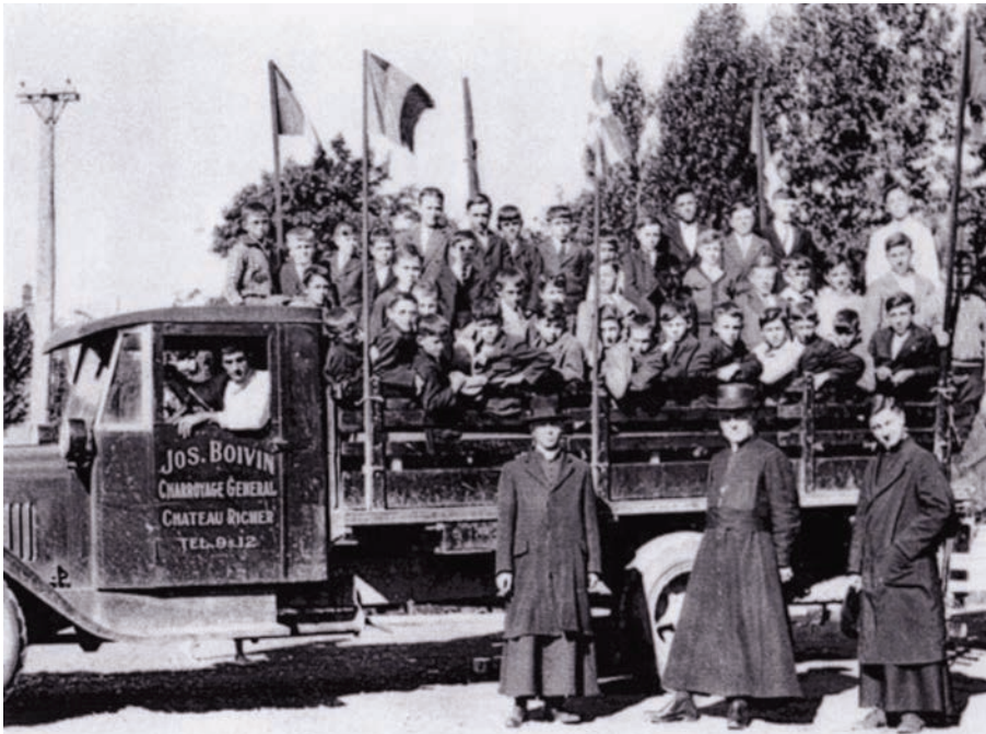
Camion rempli d'étudiants vers la fin des années 1920 à Château-Richer, près de Québec. (Ministère des transports du Québec).

du ministère de la Voirie une administration routière efficace.