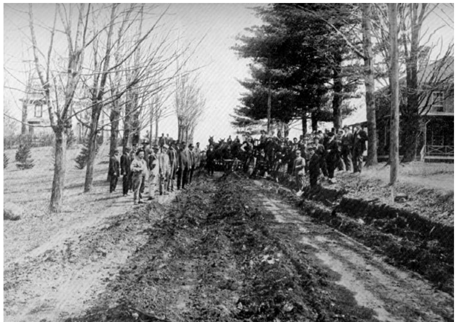
Cours de macadamisage à Knowlton, 1913. (Rapport du ministère de la Voirie de la province de Québec, 1913).

Le ministère de l'Agriculture devait orchestrer une campagne de « propagande », comme on disait à l'époque, en faveur des bonnes routes dans les journaux, dont le Journal d'agriculture , et par le biais de conférences aux quatre coins de la province. Cette stratégie de com-