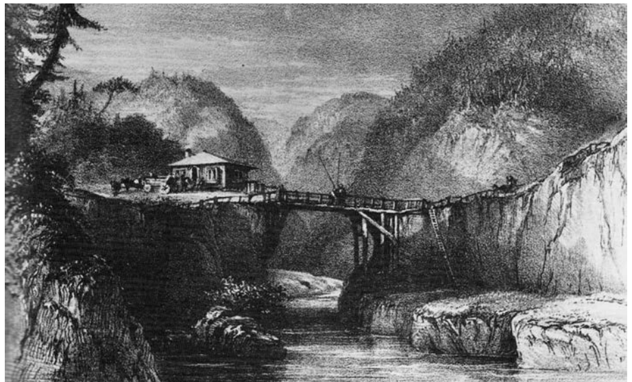
La maison du gardien du pont de péage Déry (Pont-Rouge, Québec). Gravure d'après une œuvre de R. J. Hamerton publiée en 1845. (Frederick Tolfrey, The Sportsman in Canada ).

Le site historique du pont Royal (renommé pont Déry) à Pont-Rouge, qui conserve sa maison du péager bâtie en 1804, est probablement le plus précieux vestige de cette époque. Il tire son nom de la famille qui a habité la maison de 1816 à 1939. Le premier pont de bois est construit au-dessus de la rivière Jacques-Cartier à une dizaine de kilomètres de son embouchure afin de profiter du rétrécissement de son cours entre des rochers escarpés. Ce pont à péage « curieusement construit », selon l'expression de l'officier britannique Frede-