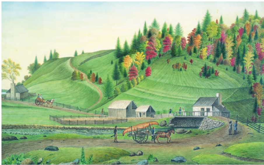
Vue du pont de la rivière du Sault-à-la-Puce, près de Québec, 1790. Aquarelle de Thomas Davies.

appuyés sur des caissons de bois et de pierre pour en allonger la portée. Ils inspirent aussi les écrivains. Ainsi, Philippe Aubert de Gaspé écrit, en 1863, dans Les Anciens Canadiens : « J'ai dit [...] que j'étais ami du progrès : je me rétracte. La civilisation a tué la poésie : il n'y en a plus que pour le voyageur. Belle prouesse, en effet, exploite bien glorieux que de passer sur un pont solide comme un roc, et assis confortablement dans une bonne voiture! » Et il ajoute, en parlant des constructeurs : « On a proclamé bien haut que ces messieurs avaient été les bienfaiteurs de leur pays! Bienfaiteurs, oui; mais, poètes, non. »