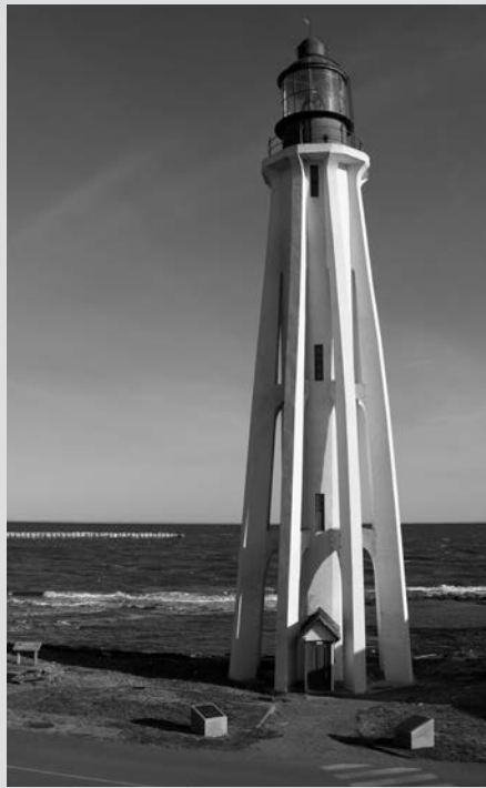
Phare de Pointe-au-Père.

( http://www.catarauquicemetery.ca/index.cfm/photo-gallery/ .)