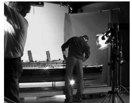
Équipe du Groupe PVP au travail.