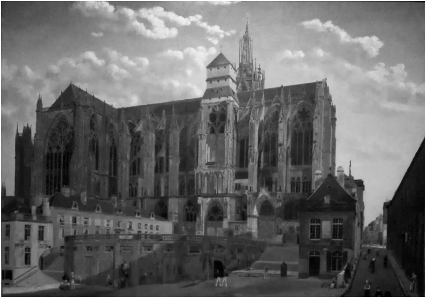
La cathédrale de Metz, telle qu'elle se présente à la naissance de Pierre-Henri Bouchy. Vue de la Cathédrale de Metz , huile sur toile, Gavard, 1826. (Musée de la Cour d'Or, Metz).