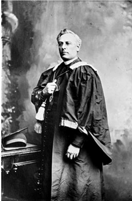
Henri-Raymond Casgrain.