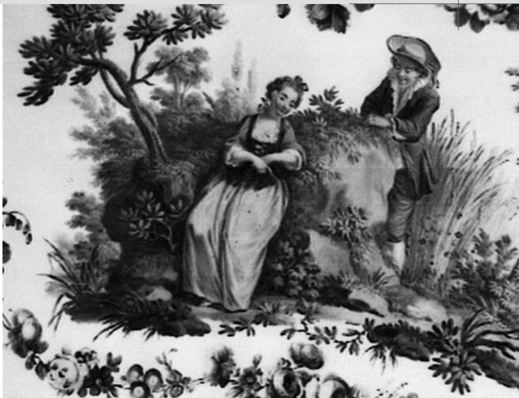
Scène galante sur une porcelaine fine du XVIII e siècle.