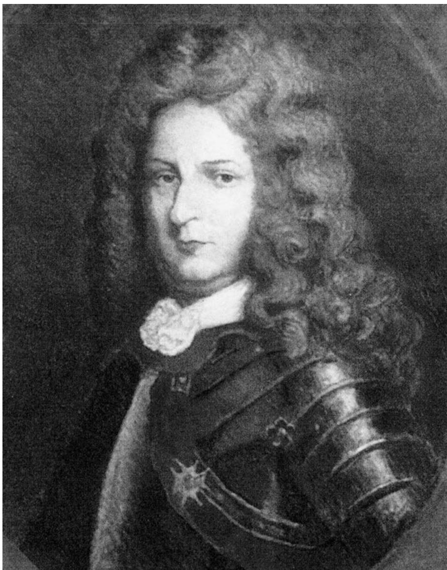
Pierre Le Moyne d'Iberville (1661-1706). Gravure tirée de Justin Winsor. Narrative and critical History of America , volume 5, 1887.

L'Ordonnance de Blois (1579) condamne ainsi ces mariages clandestins et impose la peine de mort aux coupables, « sans espérance de grâce ou de pardon ». Cependant, dès le XVII e siècle, la notion du crime est élargie. La séduction ne doit pas être nécessairement prouvée, elle peut seulement être présumée. Cette présomption peut amener une confusion, car le crime n'a plus besoin d'être