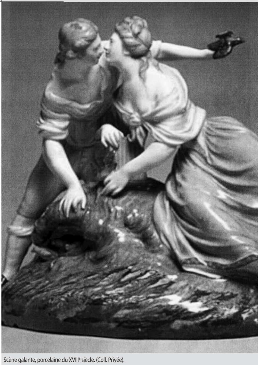
Scène galante, porcelaine du XVIII e siècle. (Coll. Privée).

Céloron de Blainville en 1711, soit six ans après le viol initial.