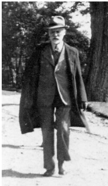
Henri Bourassa, vers 1940.

Outre la question des rentes, il faut rappeler que l'acte abolissant les droits seigneuriaux de 1854 a réservé aux seigneurs la possession pleine et entière de leurs anciennes terres domaniales, en plus d'y inclure les espaces qui n'avaient toujours pas été concédés. Ce grand changement dans les règles régissant la propriété a permis aux seigneurs (qui étaient jusque-là soumis à l'interdiction de vendre les terres du domaine) de devenir de véritables