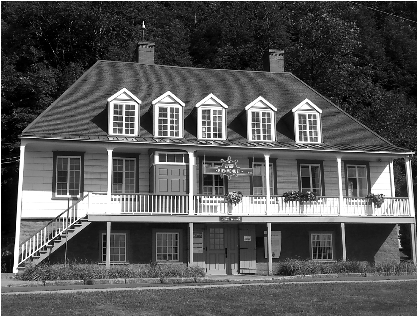
La maison Homestead aujourd'hui.