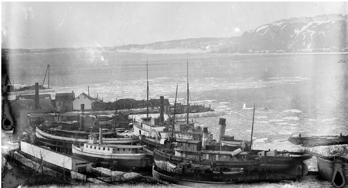
Hivernage de bateaux vers 1910. (Ville de Lévis, Secteur des archives privées, Fonds Paul Gourdeau).

jusant. Elle se vidait alors de son eau, elle était amarrée et lestée, et sa porte était fermée et calfatée. Le bateau pouvait ainsi demeurer au sec tout le temps qu'il fallait pour le réparer. Malgré leur efficacité relative, ces deux techniques étaient néanmoins dépendantes des marées.