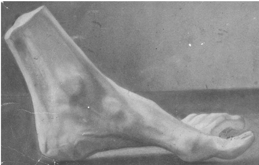
Charles Huot (Québec, 1855 - Sillery, 1930), Main, d'après le plâtre et Pied, d'après le plâtre , entre 1872 et 1874; fusains sur papier collé sur carton, Main : 23,6 x 37,5 cm (carton); 22 x 33 cm (papier); Pied : 28 x 35,4 cm (carton); 25 x 34 cm (papier). MNBAQ, don anonyme, 2017.52 et 53.

Mentionnons que Huot lui-même va ouvrir une école de peinture, à son atelier (1890), et enseigner le dessin à l'École des arts et métiers de Québec (1895). À cet égard, L'Atelier du peintre , un tableau daté de 1909 (MNBAQ), nous montre un buste antique posé sur une table et trois plâtres accrochés au mur, dont une main semblable à celle représentée sur les deux fusains. Avec ses chantiers marquants que sont la décoration de l'église Saint-Sauveur de Québec et l'hôtel du Parlement, Charles Huot sera reconnu comme une figure majeure de l'histoire de l'art québécois. La carrière et la production de cet artiste seront étroitement reliées à la capitale et à son musée national. En effet, le MNBAQ, principal dépositaire de ses œuvres, dénombre pas moins de 112 pièces