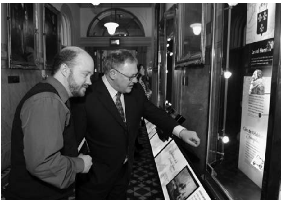
Le président de l'Assemblée nationale du Québec, M. Jacques Chagnon, visitant l'exposition Gouverner en Nouvelle-France . (Photo : Roch Thérault, Archives de l'Assemblée nationale du Québec).

la publication du livre Québec : quatre siècles d'une capitale afin de marquer le 400 e anniversaire de la fondation de la ville de Québec. Et on souligne présentement les 350 ans de la création du Conseil souverain avec une exposition, à l'hôtel du Parlement, qui couvre l'histoire politique de l'Ancien Régime.