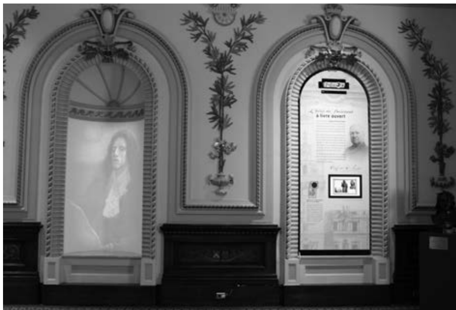
Images de l'exposition Gouverner en Nouvelle-France . (Photo : Pierre Morissette, Archives de l'Assemblée nationale du Québec).

Toujours « sous les auspices de la législature de Québec » sont édités les Jugements et délibérations du Conseil souverain de la Nouvelle-France . Publiés de 1885 à 1891, les six volumes de cette série reproduisent les travaux du Conseil souverain de 1663 à 1716. On charge l'ancien premier ministre du Québec, Pierre-Joseph-Olivier Chauveau, de rédiger l'introduction historique du premier volume, introduction qui sera également publiée dans un tiré à part.