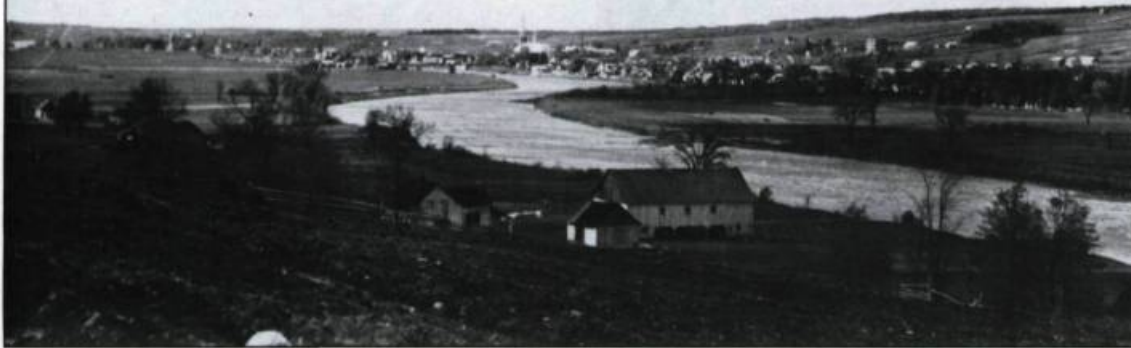
Le village de Saint-Marie-de-Beauce, en 1944.