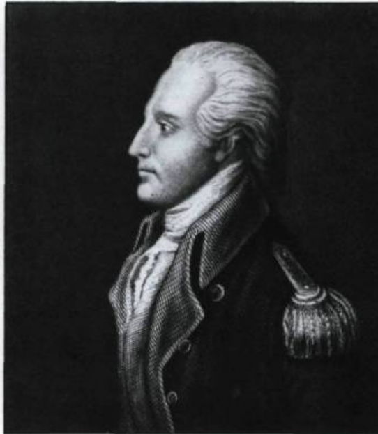
Portrait de Benedict Arnold (1741-1801), officier dans l'armée américaine.

Le chemin de fer fait enfin son entrée à Saint-Georges en 1907, ce qui facilite le transport du bois et favorisera l'industrialisation subséquente. Le projet de rendre le chemin de fer de la Beauce jusqu'aux États-Unis, en suivant la route Lévis-Jackman, est abandonné avec la faillite du Kennebec Railway. La nouvelle compagnie, le Québec Central, préfère relier Lévis aux États-Unis par les