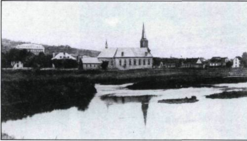
Beauceville, vers 1900.