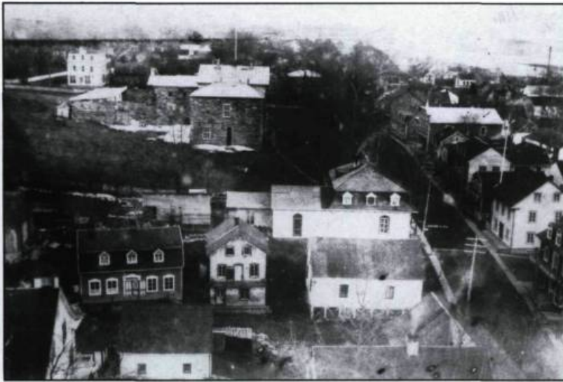
Vue du village de Saint-Joseph-de-Beauce, au début du XXI ème siècle. (Archives nationales du Québec).

habitants à développer une économie autarcique fondée sur le troc et l'entraide. De la lutte contre les rigueurs climatiques et de l'isolement naissent la tradition des corvées, l'habitude des Beaucerons de se faire justice eux-mêmes, de se débrouiller seuls et de s'identifier d'abord à la région, plutôt qu'à la province ou au pays. Les crues répétées de la Chaudière, qui l'ont rendue célèbre car elles emportaient souvent tout sur leurs passages: maisons, granges, bestiaux et ponts, vont renforcer l'habitude de se serrer collectivement les coudes face aux défis. Le dynamisme économique, qui fait citer la Beauce en exemple, puise ses sources dans ces formes d'entraide et de solidarité.