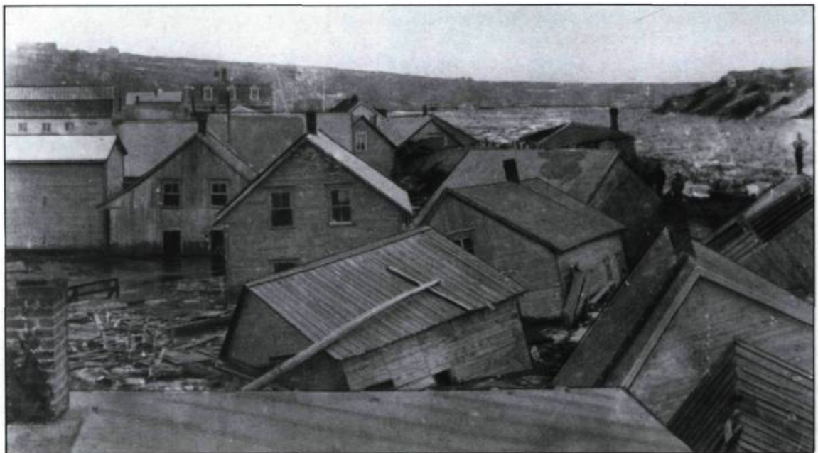
Saint-George-de-Beauce au lendemain de la plus importante débâcle de la rivière Chaudière (1896).

Le Blocus continental de Napoléon, en 1806, force l'Angleterre à s'approvisionner en bois