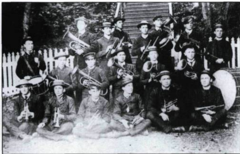
Fanfare du collège de Sainte-Anne-de-la-Pocatière, vers 1880. (Archives du collège de Sainte-Anne-de-la-Pocatière).

Certains commerçants possèdent eux-mêmes quelques livres. Ainsi, lors d'un vente aux enchères, à la suite du décès de Pierre Florence, marchand français résidant à Rivière-Ouelle à la fin du XVIII ème siècle, on vend l' Histoire du Peuple de Dieu à Antoine Besançon, également marchand à Rivière-Ouelle, et l' Histoire Générale des Goths à Nicolas Bouchard. Cependant, un troisième ouvrage, l' Histoire de l'Éthiopie , ne peut trouver preneur.