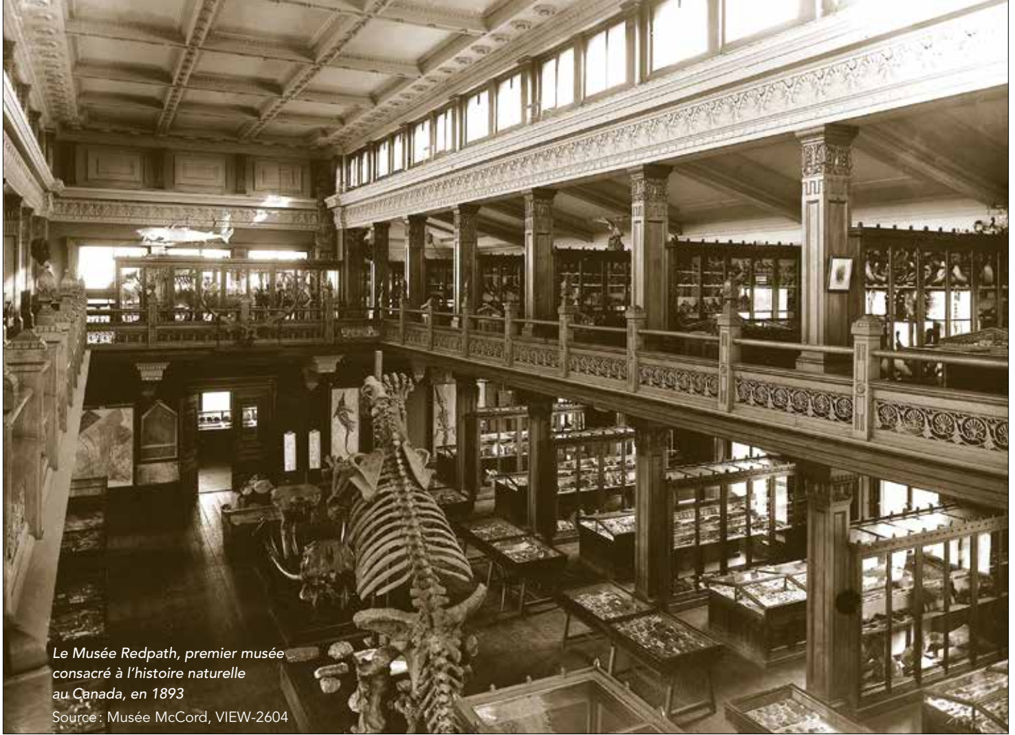
Le Musée Redpath, premier musée consacré à l'histoire naturelle au Canada, en 1893