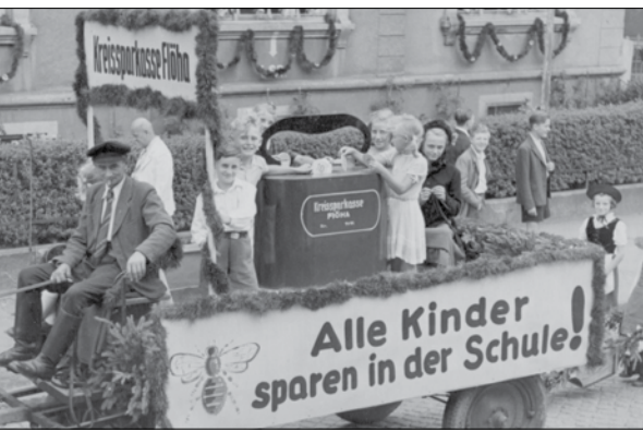
Les tirelires inspirent! À preuve, ce kiosque de l'exposition industrielle de Gävle, en Suède, en 1946, et ce char allégorique de la Kreissparkasse Flöha, en Allemagne, en 1950.