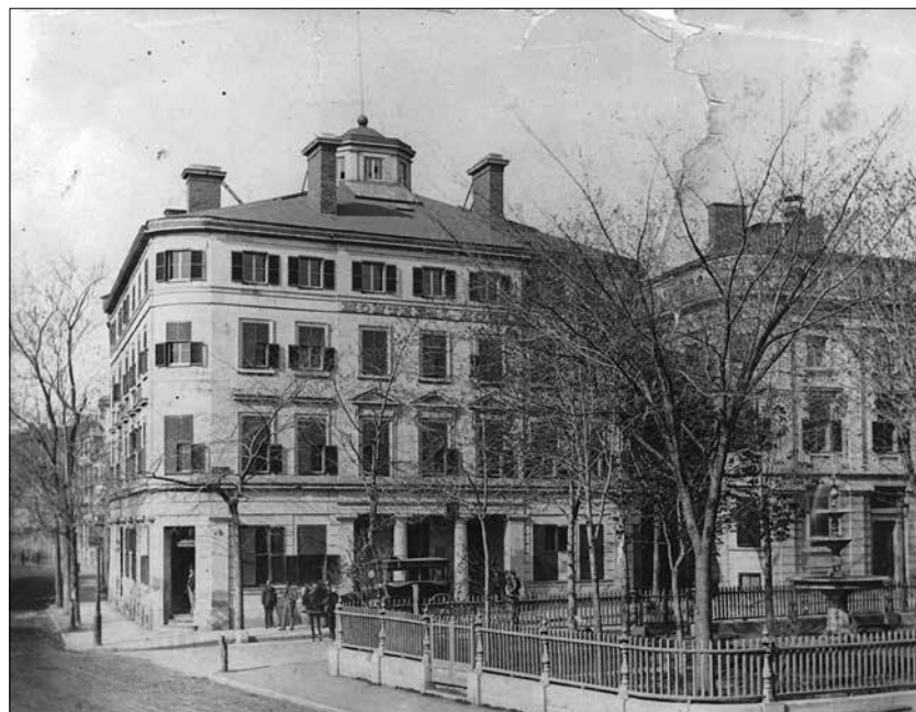
Vers 1880, époque où cette photo a été prise, la Montreal House était un hôtel. Une vingtaine d'années plus tard, l'immeuble de style géorgien accueillera le Montreal Sailors' Institute, un refuge pour les marins de passage.

L'institut ne fait pas qu'assurer le confort des marins en mettant à leur disposition des lits, des installations sanitaires et d'autres services (bureau de poste, services bancaires, salle de lecture, etc.). Animée par des convictions évangéliques, la direction souhaite également exercer sur ses pensionnaires une influence morale. Les services religieux et les réunions de tempérance occupent une place centrale dans l'œuvre de l'institut, mais les activités récréatives restent les plus