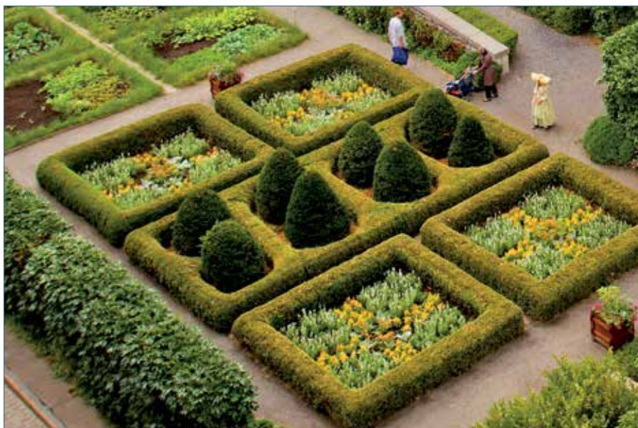
Sans reproduire à l'identique le jardin de l'époque de la Nouvelle-France, le jardin du Château Ramezay témoigne du style et du contenu des jardins de la noblesse montréalaise du XVIII e siècle.