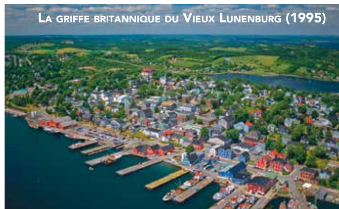
LA GRIFFE BRITANNIQUE DU VIEUX LUNENBURG (1995)

dans l'habitat vital qu'il offre à plusieurs espèces. Ses prairies d'herbe et de laïche vierges, parmi les plus vastes et les dernières en Amérique du Nord, abritent le plus important troupeau de bisons en liberté au monde. Quant à son delta intérieur d'eau douce, le plus imposant à l'échelle mondiale, une multitude d'oiseaux aquatiques et migrateurs sauvages y vit. Même que la dernière bande migratrice de grues blanches de la planète y a son aire de nidification protégée. Autre fait à signaler: on y trouve le plus gros barrage de castors du monde.