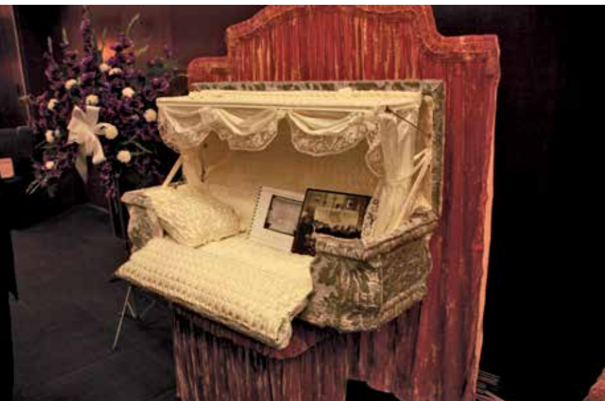
L'an dernier, le congrès annuel de la Corporation des thanatologues du Québec a été l'occasion d'une exposition sur l'histoire du monde funéraire au Québec. On y présentait entre autres ce cercueil pour enfant.

La culture se reflète jusque dans les épitaphes. « Leur langage est lié aux courants littéraires de leur époque, relate Jean Simard.