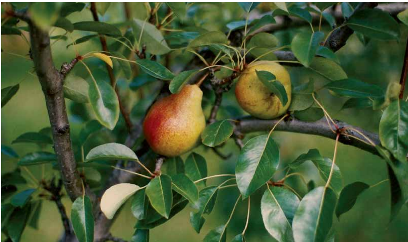
La poire Beauté flamande, venue de Belgique, a été introduite à Boston en 1834.