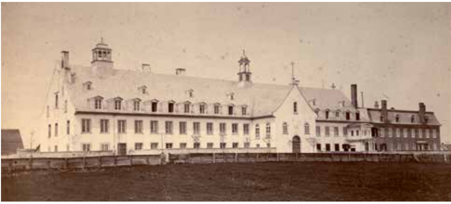
À l'origine, l'aile Saint-Joseph (à droite) se démarque de l'ensemble conventuel. Vers 1896, son mur donnant sur la rue sera enduit de crépi et blanchi à la chaux pour s'harmoniser au reste de la façade.

Photo : L. Grenier, Collections et archives | Pôle culturel du monastère des Ursulines, MTR/2/1/20,1-5