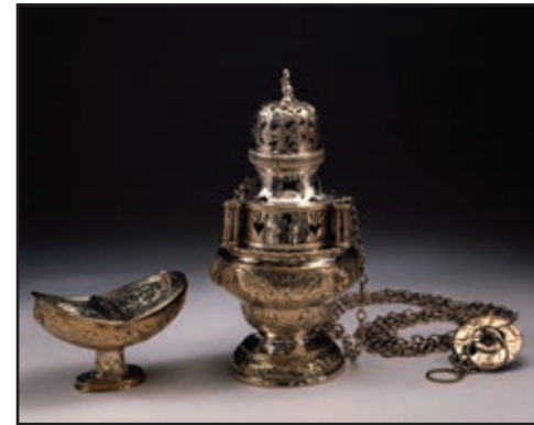
Des recherches récentes ont permis de reconstituer un ensemble appartenant à M re Briand, dont font partie cet encensoir et cette navette en argent réalisés par François Ranvozyé entre 1771 et 1794.

Dans leur accumulation d'œuvres d'art, les prêtres ont eu le mérite de constituer un répertoire d'images unique et excessivement riche sur