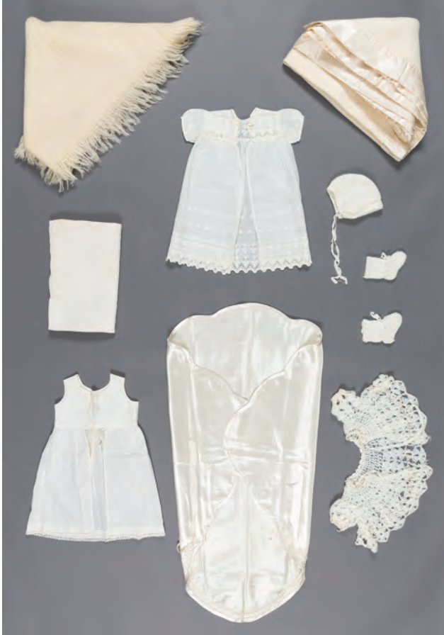
Les musées tendent à refuser les articles qu'ils possèdent en quantité, dont les ensembles de baptême. Ici, un trousseau légué par Yves Beaugard au Musée de la civilisation (2009-164).