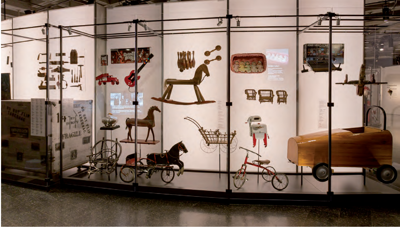
Il ne suffit pas de recueillir des objets, encore faut-il les faire découvrir à un large public. L'exposition Sortir de sa réserve : 400 objets d'émotion , présentée au Musée de la civilisation en 2018-2019, faisait la part belle au patrimoine familial.