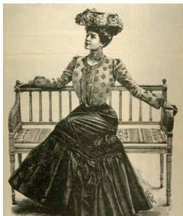
Ill. : Toilette pour jeune femme, L'album universel , vol. 19, n° 11, coll. BAnQ

voir les couleurs et les textures en vogue ainsi que des documents iconographiques qui mettent l'ensemble en perspective.