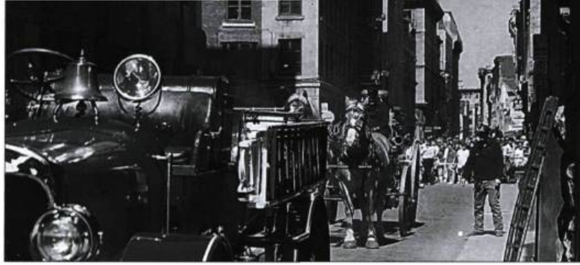
Défilé de voitures anciennes lors de la Fête de l'histoire, édition 1996. Cette fête a été organisée par les commerçants de la rue Saint-Paul en collaboration avec les musées et le Bureau de promotion du Vieux-Montréal.