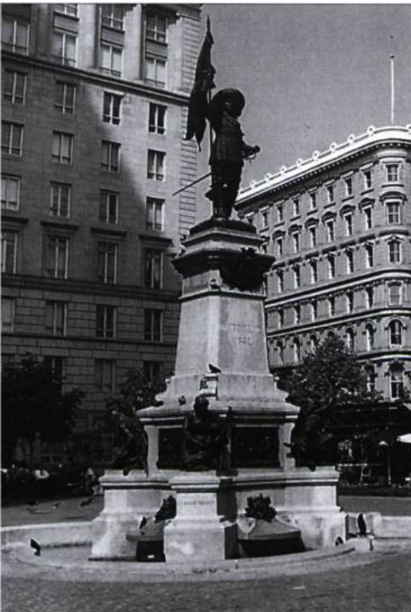
Les monuments et les plaques font partie des premiers éléments commémoratifs du Vieux-Montréal. Ici, la statue de Maisonneuve sur la place d'Armes.

Les « outils d'interprétation » à sa disposition, hormis les publications, sont peu nombreux. Pour inscrire l'histoire au moment où elle s'efface, on a alors recours à des plaques commémoratives, ces ancêtres des panneaux d'interprétation, à des monuments et à des expositions.