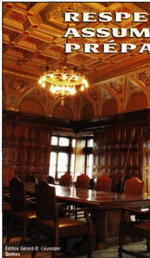
Édifice Gérard-D.-Lévesque Québec