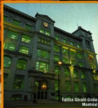
Édifice Gérard-Godin Montréal