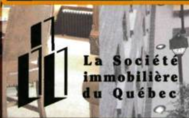
La Société immobilière du Québec