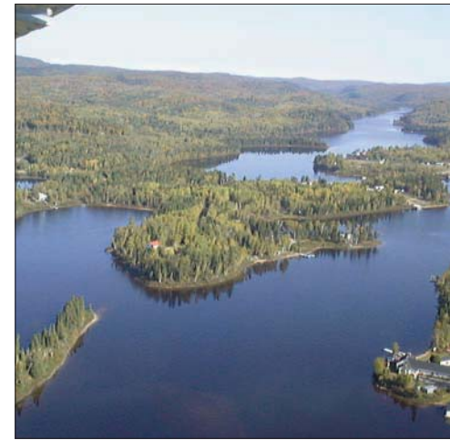
Vue aérienne du secteur de Lac-Édouard