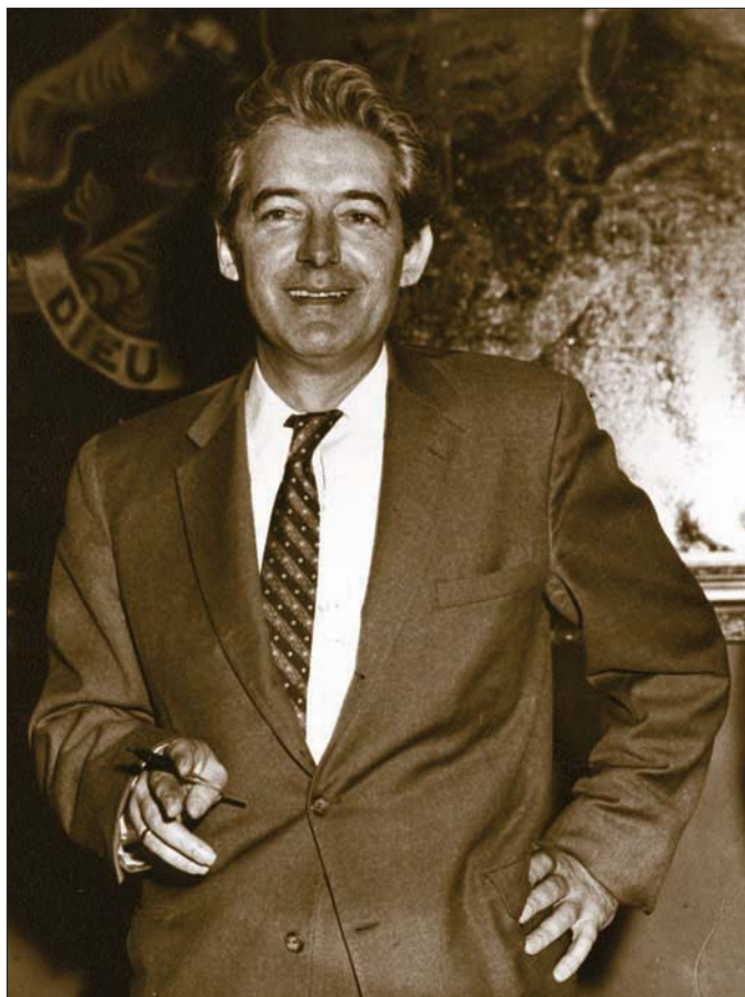
Félix Leclerc en visite à La Tuque, sa ville natale, en 1961