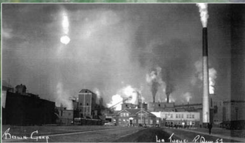
La Brown en 1951