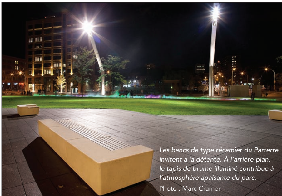
Les bancs de type récamier du Parterre invitent à la détente. À l'arrière-plan, le tapis de brume illuminé contribue à l'atmosphère apaisante du parc.