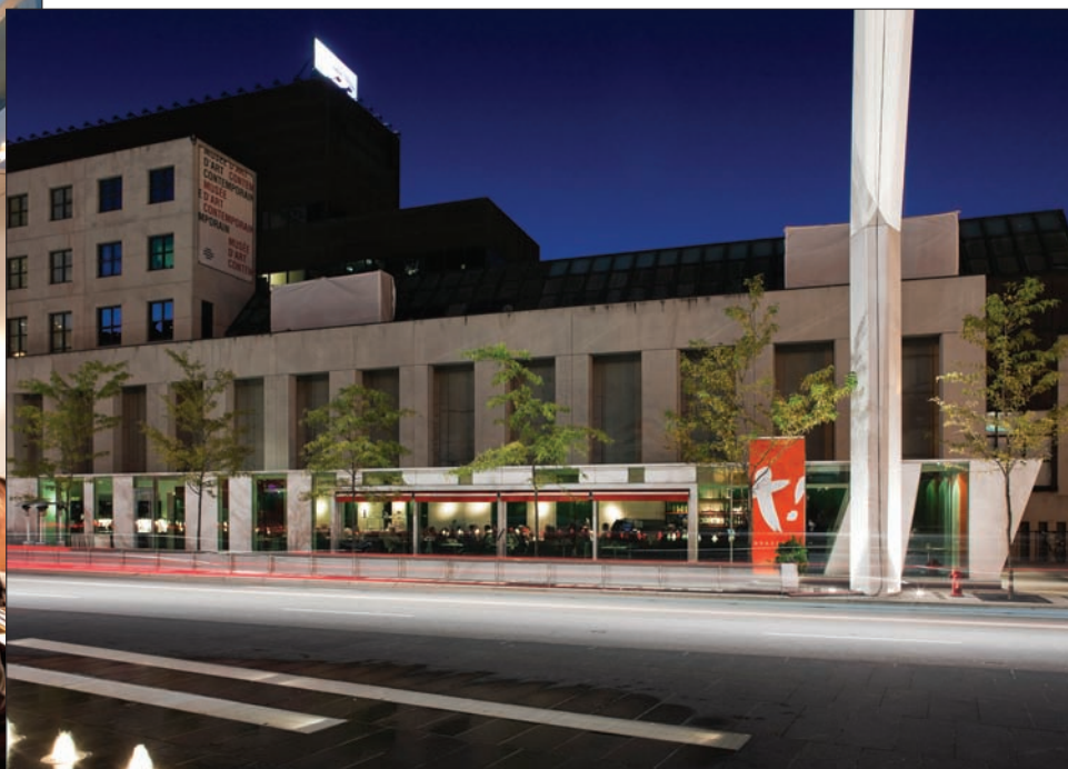
Les Vitrines habitées qui logent des restaurants brisent habilement le mur aveugle du Musée d'art contemporain. Les clients qui y mangent sont à la fois témoins et acteurs du spectacle de la rue.