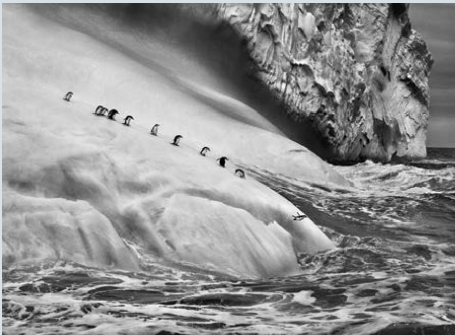
Sebastião Salgado, Chinstrap penguins ( Pygoscelis antarctica ) on an iceberg located between Zavodovski and Visokoi islands. South Sandwich Islands, 2009. © Sebastião Salgado / Amazonas Images