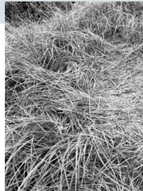
Marlene Creates, Sleeping Places, Newfoundland, excerpt / extrait, 1982

encounter with this photographer? The people in the Brazilian village of Zo'e helped Salgado build a studio out of leaves to provide a more uniform background for compositions. In one of the most striking – but constructed – images, ten women and girls relaxing in hammocks or applying pigment to their naked bodies are arrayed across a pattern of shining leaves. Is this so different from the much-critiqued French Orientalist paintings of Arab women lounging in Turkish baths? Salgado's Genesis also recalls Edward Curtis's pictorial and staged photographs of indigenous people of North America. Rather than the ecological innocence of Genesis , it is Salgado's unique field of vision that prevails. A further complication is that although Salgado's purpose is to show what remains untouched by environmental destruction and to inspire its preservation, this costly eight-year project in