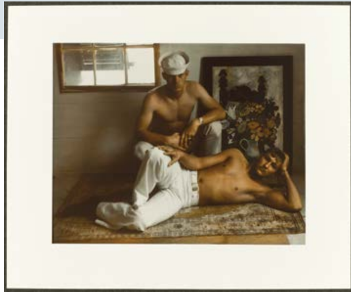
Marie Cosindas, Sailors, Key West, 1966 , dye transfer print / épreuve par transfert hydrotypique, 28 x 35 cm, purchase, funds donated by / achat, fonds donné par David G. Broadhurst, 2011, 2011/8

Bloodstain on Carpet, Belgian Judiciary Service (1881), was a small, round cyanotype, Woman on a Lonely Road (1900). The mixing of such disciplines as ethnography, botany, art, and journalism in the exhibition invited viewers to travel back in time to the early days of photography, when practitioners from various fields gathered together around the process, before the medium was segregated into different subject areas.