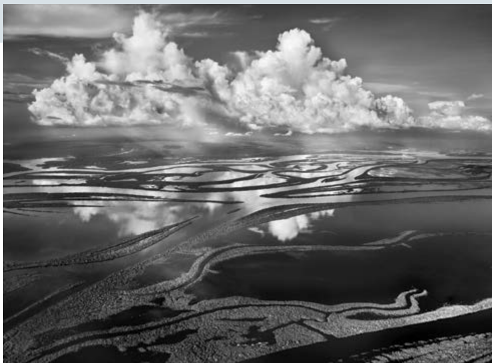
Sebastião Salgado, The Anavilhanas , the name given to around 350 forested islands in Brazil's Rio Negro, form the world's largest inland archipelago. Covering 390 square miles (1,000 square kilometers) of Amazonia, they start 50 miles (80 kilometers) northwest of Manaus and stretch some 250 miles (400 kilometers) up the Rio Negro, as far as Barcelos. Amazonas, Brazil, 2009. © Sebastião Salgado / Amazonas Images

following the format of Nadar's Revolving Self-portrait (1865). In After Nadar: Pierrot Turning (2012), Maggs again entered the picture as whiteface mime, and with each turn he gave slices of himself, as had Nadar and Kertész before him.