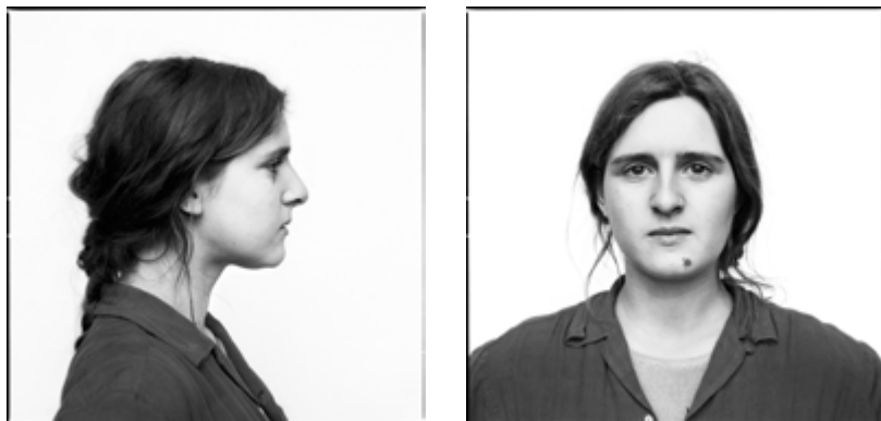
Arnaud Maggs, Kunstakademie (detail / détail), 1980; After Nadar: Pierrot Turning , 2012, © Estate of Arnaud Maggs, courtesy of / permission de Susan Hobbs Gallery, Toronto