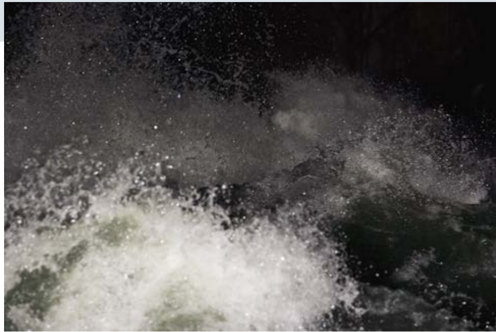
Andrew Wright, Nox Borealis , 2012, c-print / épreuve chromogénique; Standing Wave #6 , 2007, chromira light jet print / impression jet de lumière chromira, collection of / de Museum London

startling details in two giant negative prints, produced when Wright turned the gallery's spaces into camera obscurae, are more magical due to their reversed tones, suggesting the primitive thrill that viewers of this optical phenomenon experienced centuries ago ( When Buildings Take Pictures of Themselves , 2013). The camera obscura images in Skies (2003–04) are random frames of captured clouds passing overhead, taking us back to the times of William Henry Fox Talbot's The Pencil of Nature , when photography was understood as "nature writing itself." After Kurelek (2013) is a stunning Arctic panorama inspired by the painter William Kurelek's depiction of white snow. A stark white mountain cut sharply against black Arctic sky becomes abstract when presented upside down. The artist's playful tinkering with diverse media is encapsulated by a group of five mixed-media pieces that revolve around the depiction of clouds. What appears to be a historical photogenic drawing was produced with an iPhone app; the "cloud" in a wet-plate collodion image was sculpted from a crumpled paper towel.