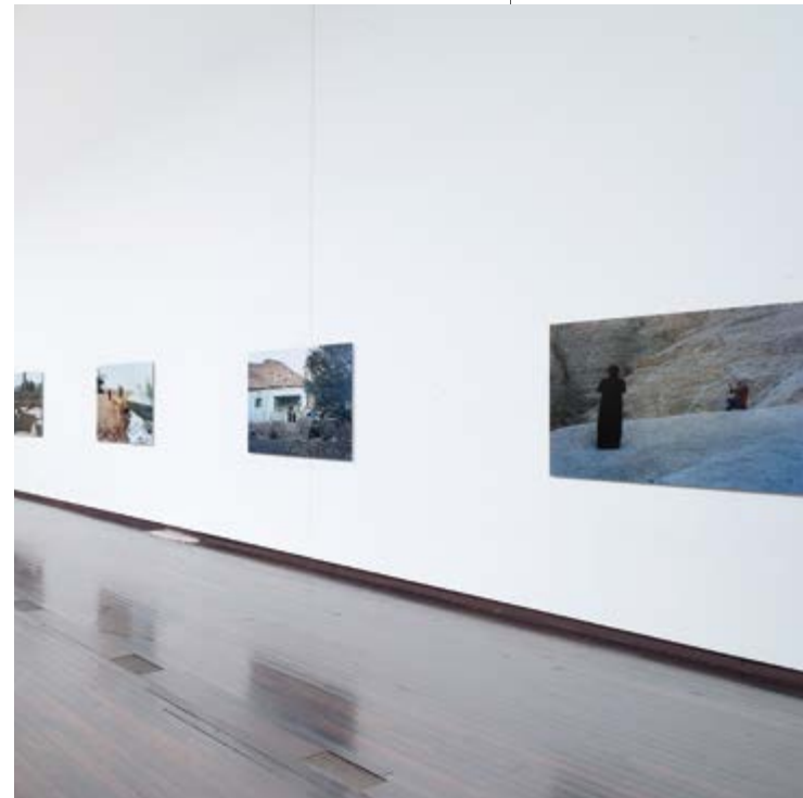
Cinq femmes du pays de la lune , 2014, vues d'exposition / exhibition views, Musée d'art contemporain du Val-de-Marne, Vitry-sur-Seine, France

appartenir à ce territoire et surtout de reconnaître l'appartenance des autres. Car, là-bas, tout le monde peut se sentir chez lui ; c'est une terre fondatrice pour beaucoup de civilisations. Depuis les Romains, cette partie du Moyen-Orient a toujours été traversée, et c'est bien le paradoxe avec Israël : pour la première fois, une invasion conduit à chasser les Palestiniens d'origine ! Il y a des communautés arrivées depuis des centaines d'années (du Sénégal, du Maroc, par exemple). Le problème pour les Palestiniens n'est pas d'accueillir l'autre, leur histoire collective en est pétrie, mais, là, il ne s'agit pas de cela !