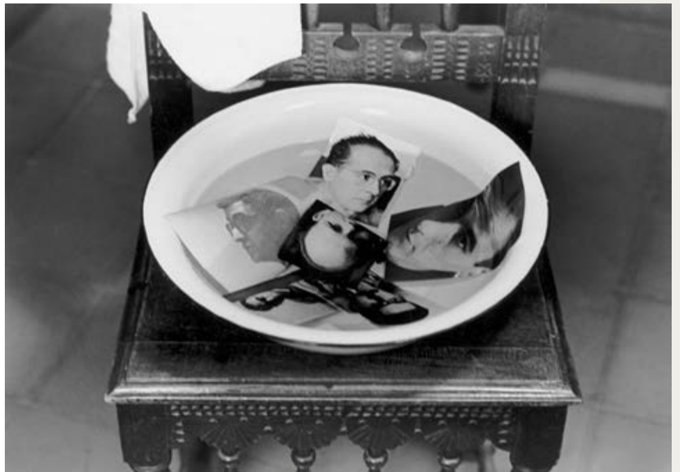
Francisco Ontañón, Integrantes de La Palangana , 1959, Archivo F. Ontañón, courtesy of / permission de la Galería Arte Sonado