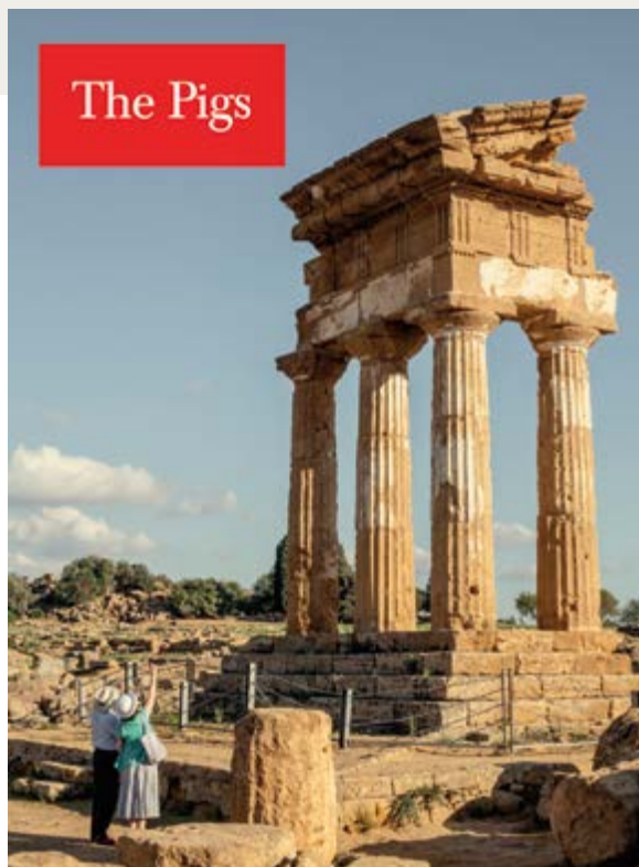
Carlos Spottorno, cover of / couverture de The Pigs , 2013