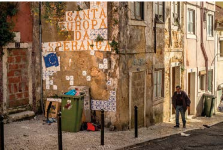
Carlos Spottorno, The Pigs , 2013