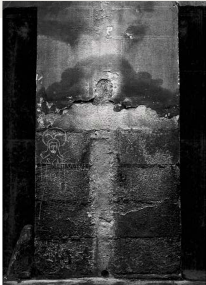
Paco Gómez Martínez, Cristo , 1959, courtesy of / permission de la Fundació Foto Colectania

Anonymous / Anonyme, Actriz Adelaida Fernández Zapatero, 1859