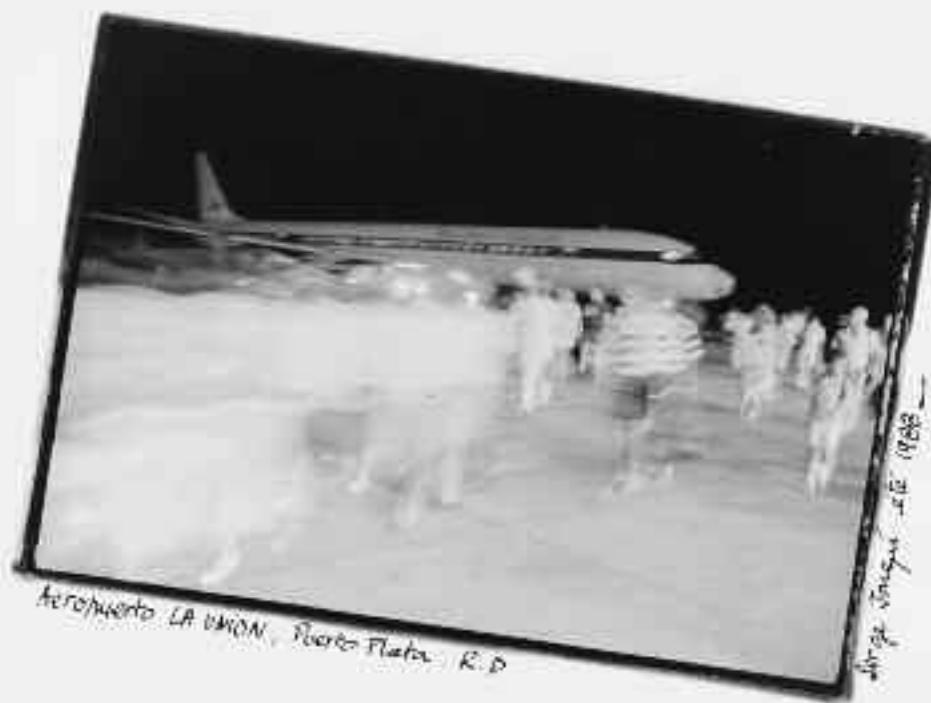
Aeropuerto LA UNION, Puerto Plata, R. D.