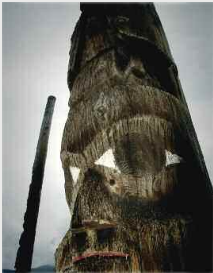
PAGES 54-55 : De la série / from the series Totem – A North American Celebration , 01; 02; 03, 2005, photographie numérique / digital photograph, 22 x 27 cm

humaniste et engagé une volonté d'accès à l'autre, comme un besoin presque viscéral d'inclure des extraits d'une mémoire collective dans la définition d'une cartographie de l'intime. En ce sens l'œuvre de Jongué se démarque des modalités autobiographiques reconnues et, de ce fait, se révèle unique au sein des pratiques québécoises.