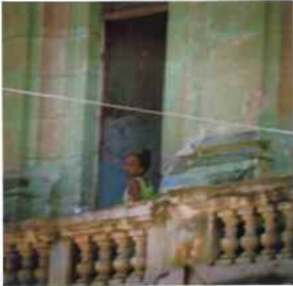
La mujer, le balcon