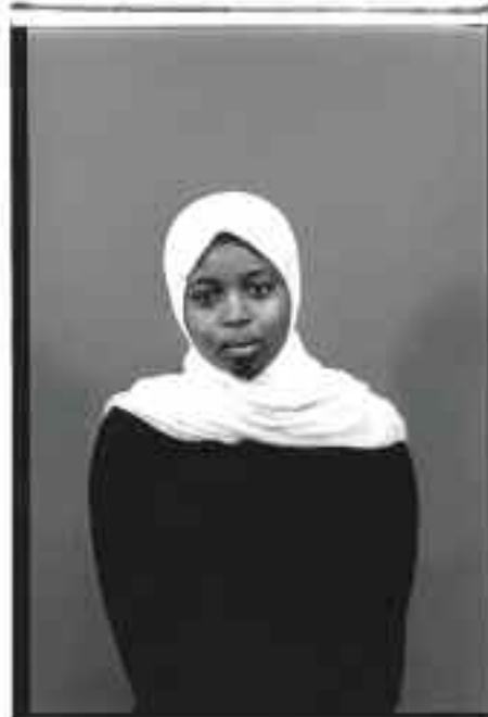
De la série / from the series Portraits dénudés, Identités métropolitaines 02 , 1990-1991, 70 x 50 cm ; 01 ; 02, 1998-1999, photographie argentique / gelatin silver photograph, 50 x 70 cm