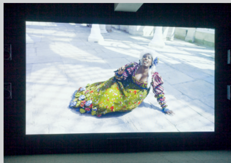
Un Ballo in Maschera (A Masked Ball) , 2004; Odile and Odette , 2005; Addio del Passato , 2011, vues de l'exposition Yinka Shonibare MBE. Pièces de résistance, 2015, DHC/ART Fondation pour l'art contemporain, Montréal

Les vidéos présentées dans l'édifice satellite de DHC/ART font subir un traitement différent aux compositions leur ayant servi de point de départ. Dans les deux cas, la musique n'est pas interprétée ; c'est la danse qui prime et ce sont les pas et les souffles qui deviennent la trame sonore. Odile and Odette (2005, 14 min 28 s), une commande du Royal Opera and Ballet de Londres, s'inspire du Lac des Cygnes de Tchaïkovski pour s'attaquer aux sacro-saintes polarités blanc/noir, bon/mauvais, positif/négatif. Traditionnellement, c'est la même ballerine qui interprète le rôle de la princesse Odette, tout de blanc vêtue, et celui d'Odile, toute en noir. Shonibare, lui, fait jouer les personnages par deux danseuses, soit une Blanche et une Noire portant un costume identique en wax multicolore. Les deux accomplissent les mêmes mouvements en face à face,