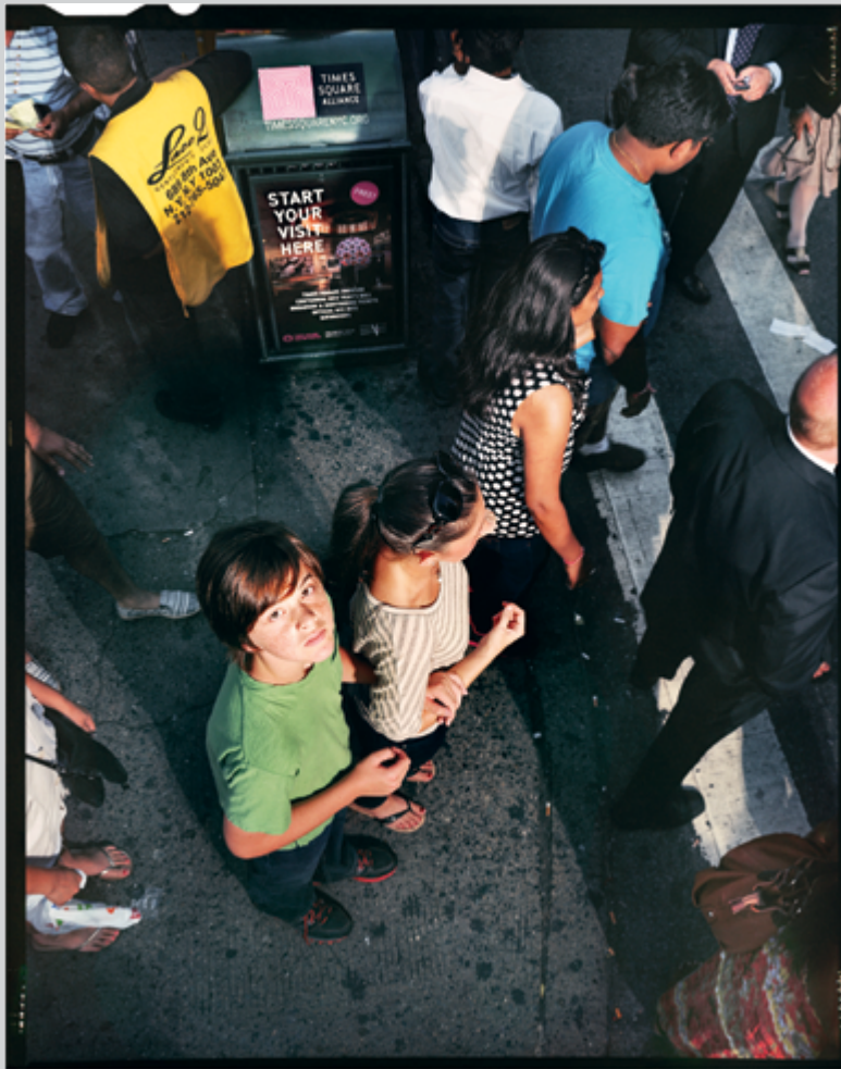
Ethan Levitas, Frame 21, Photographs in 3 Acts , 2012

Il fallait être doté d'un esprit boulimique pour s'attaquer à la 47 e édition des Rencontres d'Arles. Cette année encore, le festival proposait pour sa semaine d'ouverture et durant tout l'été de quoi boire et manger plus qu'à satiété (une quarantaine d'expositions, sans compter les événements du off et toutes les animations parallèles, comme le salon du livre photographique Cosmos Arles Books et le VR Arles festival, premier festival artistique consacré à la réalité virtuelle). Dédiée à l'écrivain Michel Tournier (cofondateur des Rencontres en 1970, disparu au début de l'année), cette édition avait pour vocation de satisfaire un public le plus large possible, en présentant toutes les tendances, de la photographie documentaire et de reportage (Grossman, McCullin ou Morvan) à des pratiques plus conceptuelles et expérimentales (Boyle, Abril ou Marclay). Une programmation annoncée par son directeur, Sam Stourdzé, comme une « radioscopie de la création contemporaine » qui reflétait, en somme, un désir d'exhaustivité visant