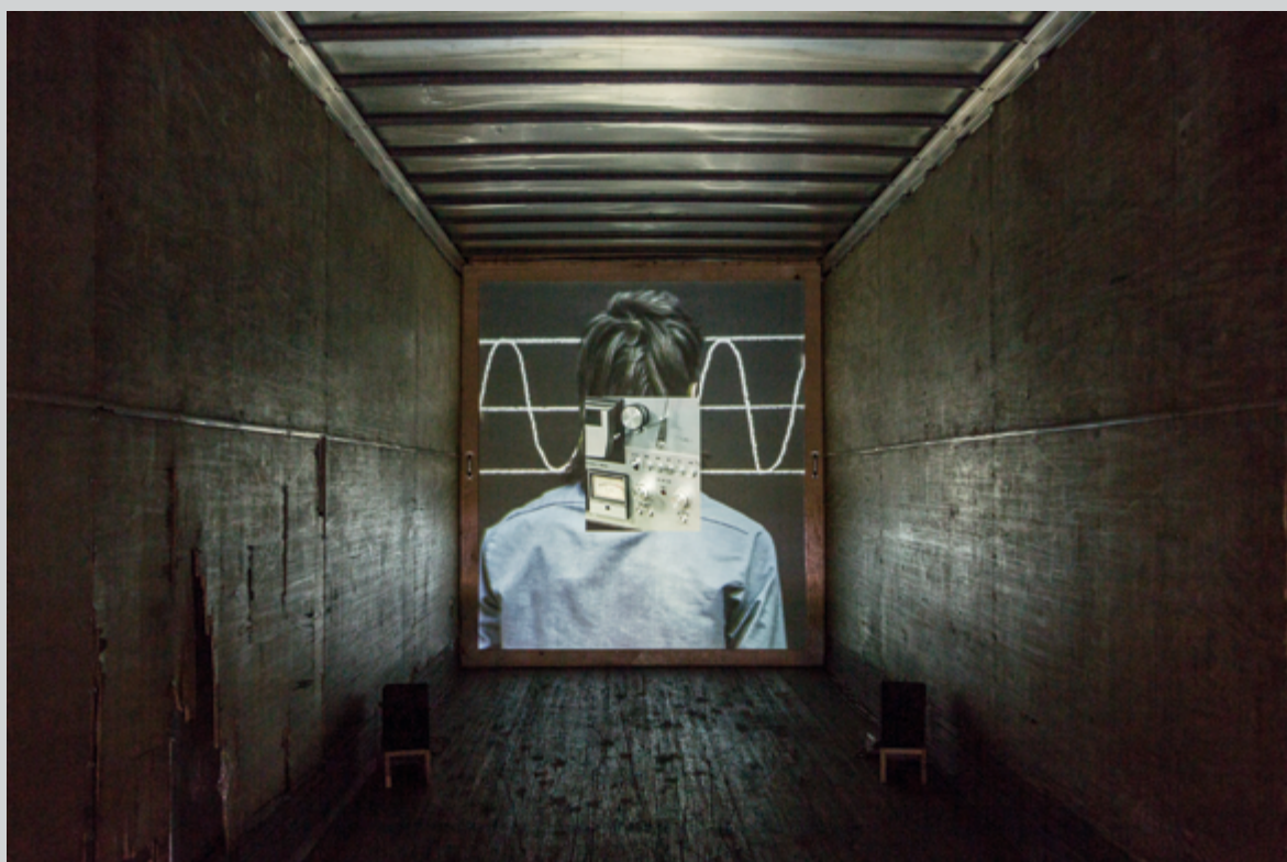
Sébastien Cliche, Le ruban , 2016, installation vidéo HD, en continu avec déroulement aléatoire, intégrée à une remorque de camion, créée pour l'évènement, photo : Sébastien Cliche

Sébastien Cliche présente, quant à lui, Le ruban , une pièce réalisée en partie sur place et qui s'inspire de ce que son séjour en ces terres lui a suggéré. Il s'agit d'une projection au fond de la remorque d'un camion. Choix judicieux puisque l'histoire relatée est justement celle de deux personnages pris d'une irrépressible envie de s'aventurer sur la route et qui rencontrent des camions qu'ils vont suivre. Ce ruban peut être celui de la route 132, qui fait le tour de la Gaspésie et dont les habitants et les visiteurs reconnaîtront l'emprise sur la vie de la région. La bande vidéo est composée de variantes d'une durée de 5 minutes 30 secondes, chacune s'ouvrant sur une courte introduction dont