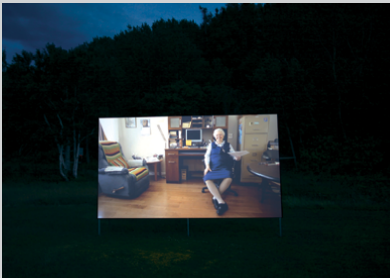
Emmanuelle Léonard, La Providence , 2014, vidéo HD, 29 min

je donne ici quelques exemples : « Dans cette histoire, quelque chose qui est caché ne sera pas révélé », « Dans cette histoire, le monde qui est là, devant nous, n'est pas assemblé », « Dans cette histoire, vous cherchez une façon de recommencer votre vie, mais qui ne dérangera personne ». Lorsque l'histoire reprend, elle est légèrement différente, puisant dans ses cycles alternatifs. Ainsi présentée, elle nous livre ses clefs, le principe de construction que son auteur a établi. L'image est parfois double ; une seconde image, épousant la forme carrée de la surface de projection, mais de plus petite taille, apparaît au centre de la première image. On y voit aussi les personnages au travail, à l'ordinateur et au ruban magnétique, en train de créer l'œuvre qui se déploie sous nos yeux, là, maintenant.