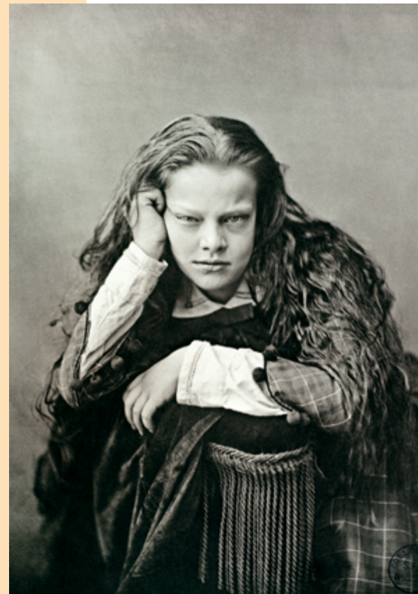
Tessié Du Motay et Maréchal Portrait de femme, premier essai de phototypie / first trial in collotype, 1866