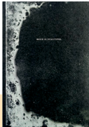
«Moisissures» extraites du livre Mold is Beautiful , paru chez Poursuite Editions, 2015