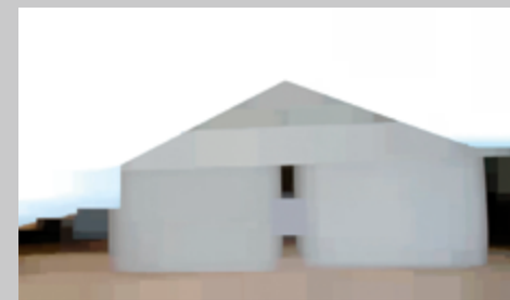
a barn at north fork, 2010, vidéo numérique HD, vidéographie, couleur, son, 24 min, en boucle permission de l'artiste et de la Cristin Tierney Gallery

Michèle Cohen Hadria collabore à diverses revues, dont artpress (Paris), Ciel variable , ETC (Montréal), N. paradoxal , Third Text (Londres). Elle s'intéresse actuellement aux pratiques artistiques du Sud.