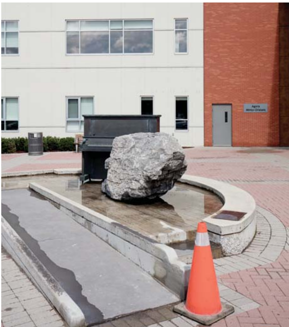
PAGE 19: Adrienne Alison , Monument de la guerre de 1812, «Triomphe grâce à la diversité» ( The War of 1812 Monument "Triumph through Diversity" ), 2014 sept figures en bronze, deux pièces en granit en forme de bateau / seven bronze figures, two granite boat-shaped pieces, parterre est de la Colline du Parlement / east lawn of Parliament Hill, Ottawa, photo 2014