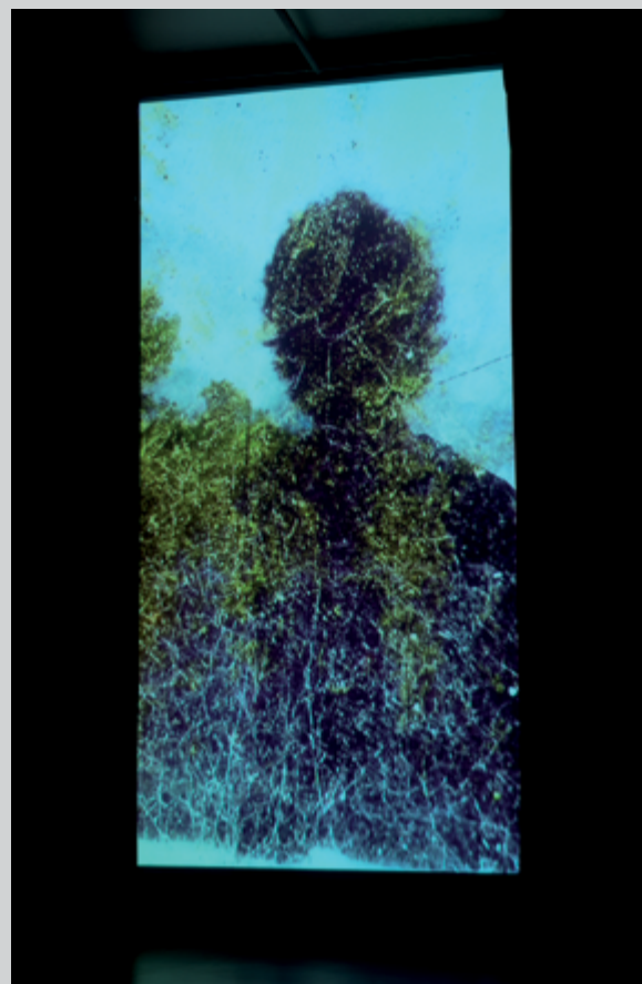
Longuay , 2017, projection vidéo double, trois vues d'exposition

insectes et des plantes effleurent le verre où le reflet de l'artiste est capté par l'objectif de la tablette – un profil que l'on entrevoit à quelques reprises et qui semble appartenir à un autre temps.