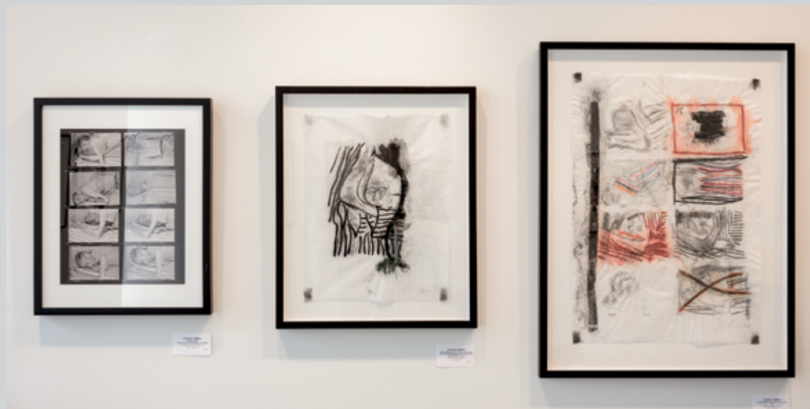
Vue partielle de l'exposition