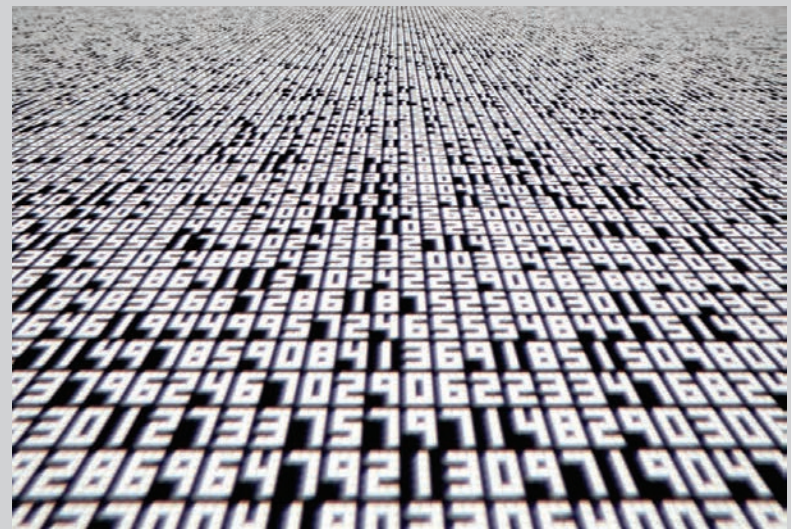
data.tron , 2007, installation audiovisuelle, photo : Ryouichi Maruo, permission de Yamaguchi Center for Arts and Media (YCAM)

D'un minimalisme saisissant, les œuvres d'Ikeda explorent toujours la vaste étendue de la pensée mathématique. De la simplicité unitaire de Line (2012), qui n'est qu'une simple fissure de lumière blanche insérée dans un mur noir, jusqu'aux foisonnantes « images spatiales » présentées dans une