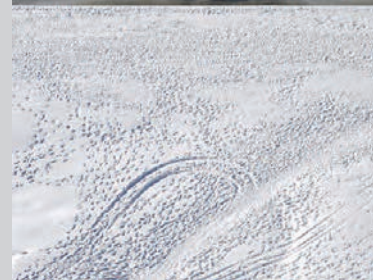
Verglas , 2012, impression à jet d'encre, 106 x 77 cm