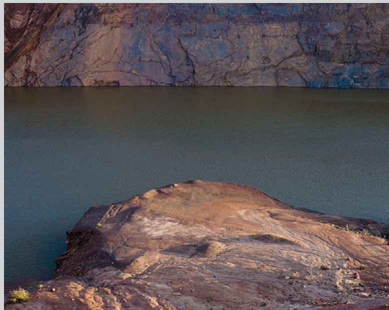
Mine 3 , 2012, impression à jet d'encre, 79 x 94 cm

Il est docteur en sociologie, critique d'art et commissaire indépendant. L'art actuel et l'art amérindien sont ses domaines d'intervention.