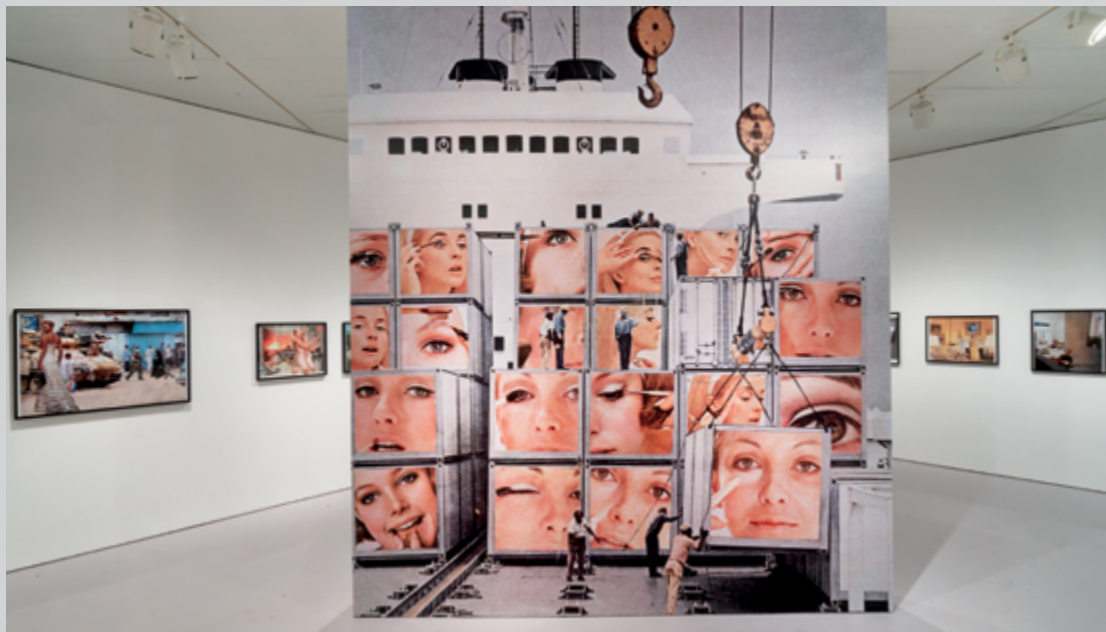
Martha Rosler: Irrespective, vue de l'exposition au Jewish Museum de New York

Rosler a également superposé la liste d'une centaine de personnes faisant partie de minorités visibles tuées par des policiers dans la rue ou pendant leur détention provisoire. C'est donc sur une ultime dénonciation des inégalités sociales que le parcours de cette exposition poignante, provocante, et dont toutes les œuvres demeurent d'actualité, se terminait. Un appel, donc, à la prise de parole et à un continu engagement politique et social, ainsi qu'à la nécessité de la circulation des œuvres de Martha Rosler dans les différentes sphères de la vie.