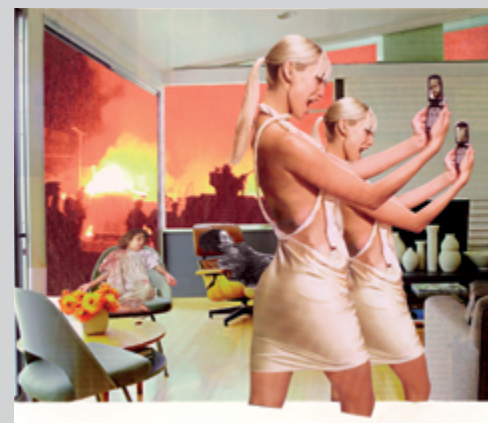
Cleaning the Drapes , de la série House Beautiful: Bringing the War Home , 1967-1972 ; Photo-Op , de la série House Beautiful: Bringing the War Home , New Series, 2004, photomontages, permission de l'artiste et de Mitchell-Innes & Nash, New York