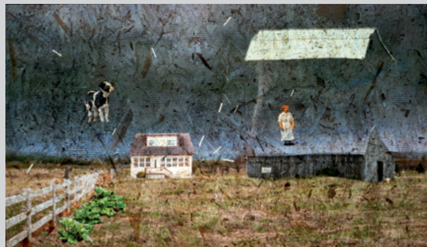
Se faire emporter par le vent, 2019, projection vidéo sur panneau de copeaux de bois, 3 min

1 Bernard Lamarche en donne une intéressante définition dans son texte intitulé « Sortir du lieu : l'installation », dans Installations . À grande échelle, Québec, Musée national des beaux-arts