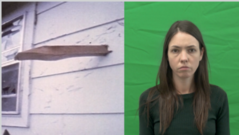
Les quatre récits d'Alice, 2019, vidéo, 1 min

L'exposition T'envoler peut être vue comme une installation à grande échelle 1 , tant les liens entre les nombreuses œuvres – plus d'une quinzaine – sont solides, et tant l'effet immersif de l'ensemble est fort. Elle est d'une ampleur et d'une complexité qui rendent impossible, ici, un compte rendu exhaustif. Nous nous concentrerons donc sur ce qui, selon moi, est le trait distinctif de l'approche de Myriam Jacob-Allard : sa sensibilité aux tonalités, qu'elles soient liées aux mots, à la musique ou aux images.