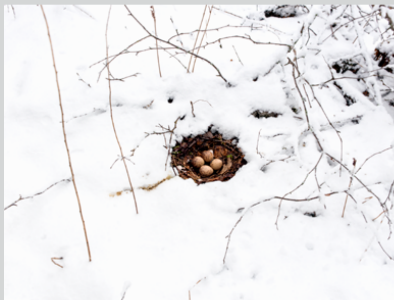
Sans titre , 2015, de la série Lot n° 126 , 81 × 108 cm

— Mona Hakim est historienne de l'art, critique et commissaire indépendante. Ses recherches portent sur divers enjeux liés aux pratiques photographiques contemporaines et actuelles. Elle est l'auteure d'essais et de nombreux textes critiques et monographiques. À titre de commissaire, elle a réalisé plus d'une vingtaine d'expositions, dont deux collectives qui traçaient un portrait synthétique de la photographie québécoise. Elle a enseigné l'histoire de l'art et l'histoire de la photographie au collégial de 1996 à 2015. —