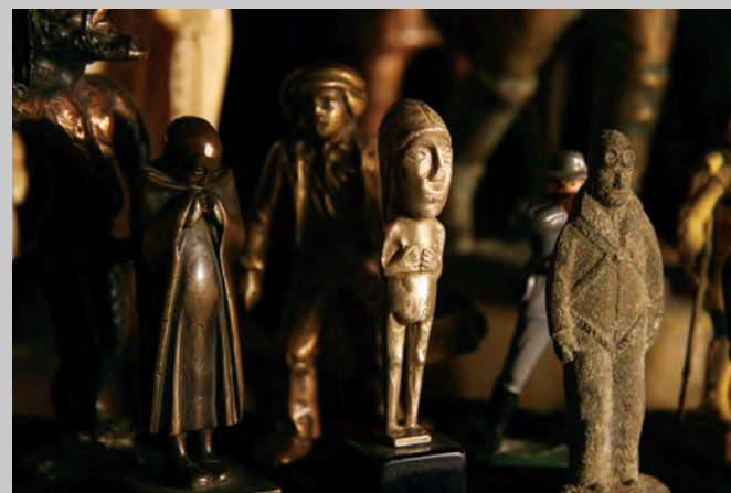
Premier plan , 2012, impression jet d'encre sur papier realistik, 74 x 111 cm

Sylvain Campeau a collaboré à de nombreuses revues, tant canadiennes qu'européennes (Ciel variable, ETC, Photovision et Papal Alpha). Il a aussi à son actif, en qualité de commissaire, une trentaine d'expositions présentées au Canada et à l'étranger. Il est également l'auteur de l'essai Chambre obscure : photographie et installation et de quatre recueils de poésie .