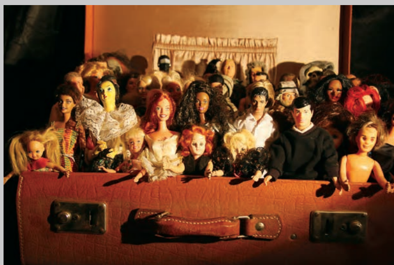
La foule , 2012, impression jet d'encre sur papier realistik, 74 x 111 cm