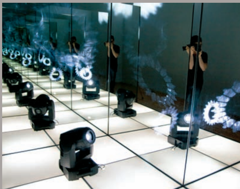
Disco solo , 2011, installation : bois, miroir, plancher lumineux, projecteur lumineux rotatif programmable, 5 x 8 m