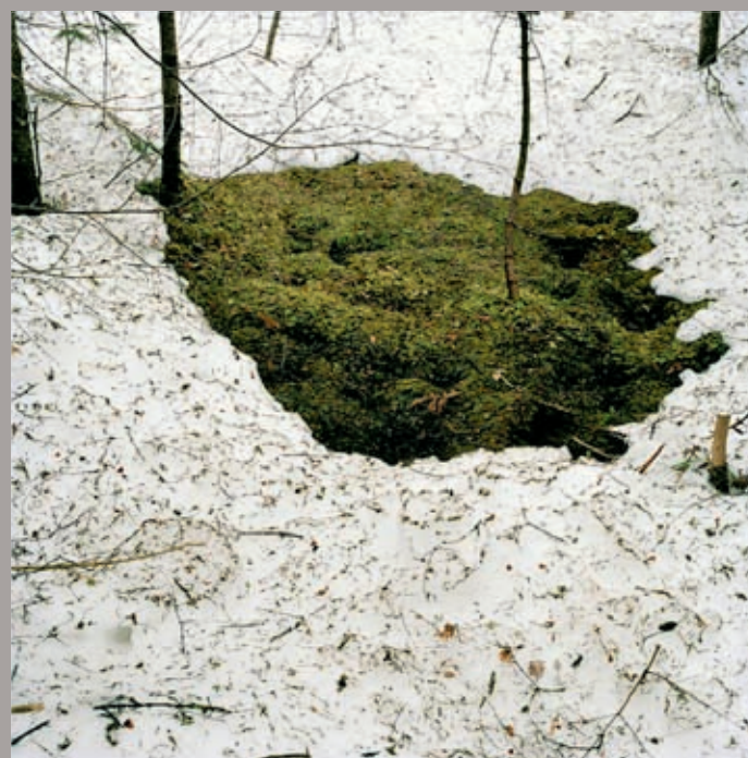
Comme un murmure (suite) No. 18 , 2010, jet print on archival paper on aluminum, 102 x 102 cm

The body of work at Galerie Pangée was the second chapter of the “Like a Whisper” show curated by Anne-Marie Ninacs as part of Le Mois de la Photo de Montréal 2011 and concurrently exhibited at L'Arsenal, in Griffintown. Whereas for the works in that space Rajotte's lens was focused very tightly on nature's turf – most of them literally displayed a square metre or so of earth, soil, grass, or mud and the animal traces that they encase, which, for the artist, act as a reference to the photographic imprint – the photographs at Galerie Pangée took a greater distance from their subject. This show featured more traditional perspectives on landscape, shot with a tripod from a standpoint that allows the viewer to see ground, horizon, and sky, as well as the forest in all its thick intensity and evocative chaos. In a way, this was a departure for Rajotte; his previous two series have been