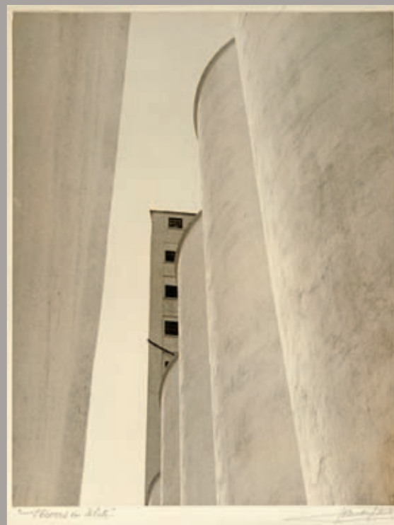
J.C.M. Hayward, Wood Pile , 1912, gelatin silver print, 47 x 35 cm; John Vanderpant, No. 2, Towers in White , around c. 1934, gelatin silver print, 35 x 27 cm, courtesy of Art Gallery of Ontario / AGO Image Resources